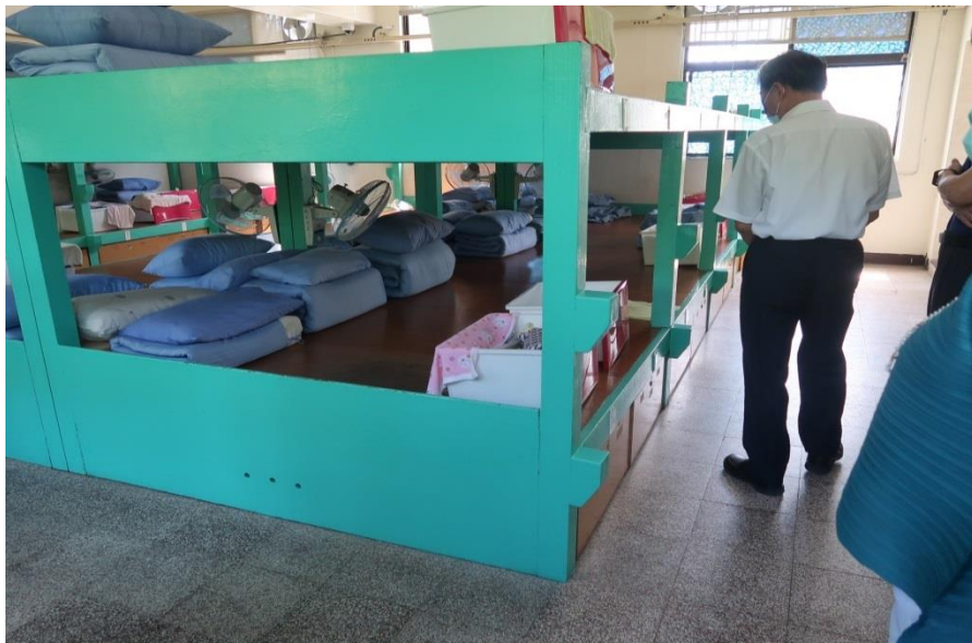
圖2、桃園分校收容學生住宿床位情形