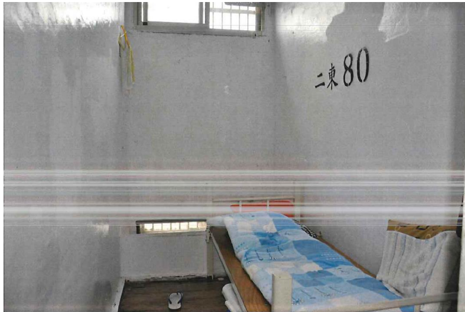
照片5 綠島監獄收容人吳○○獨居舍二東舍80號房照片