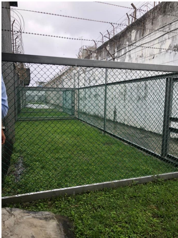
照片12 綠島監獄單獨監禁收容人獨自放封運動區域