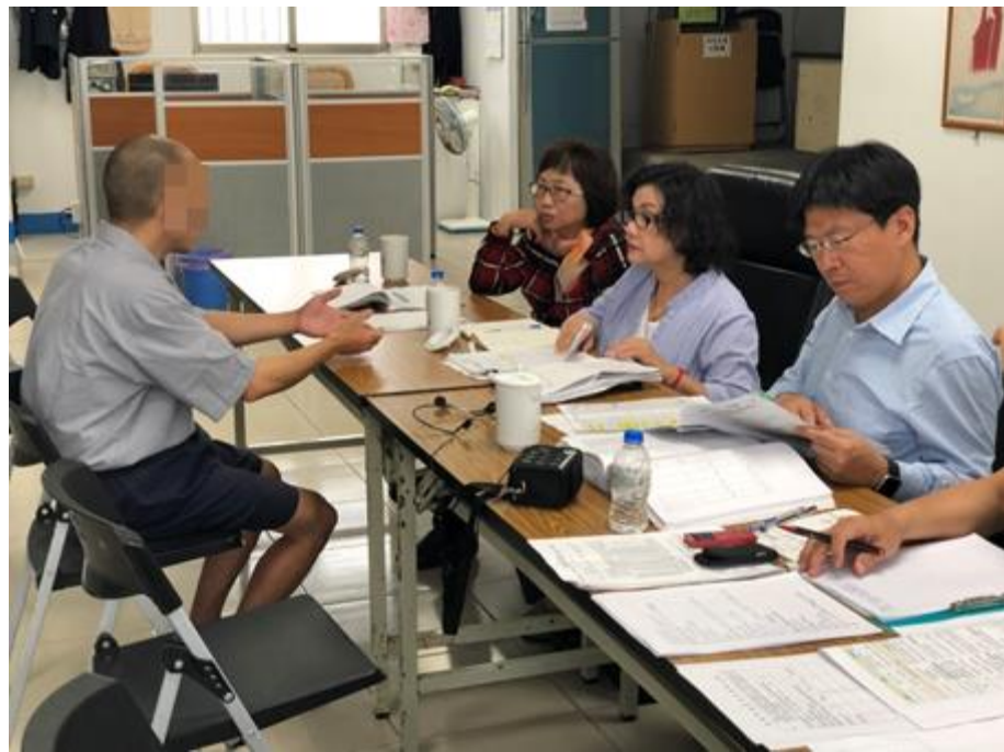
照片11 本院監察委員訪談綠島監獄遭長時間上戒具及單獨監禁收容人