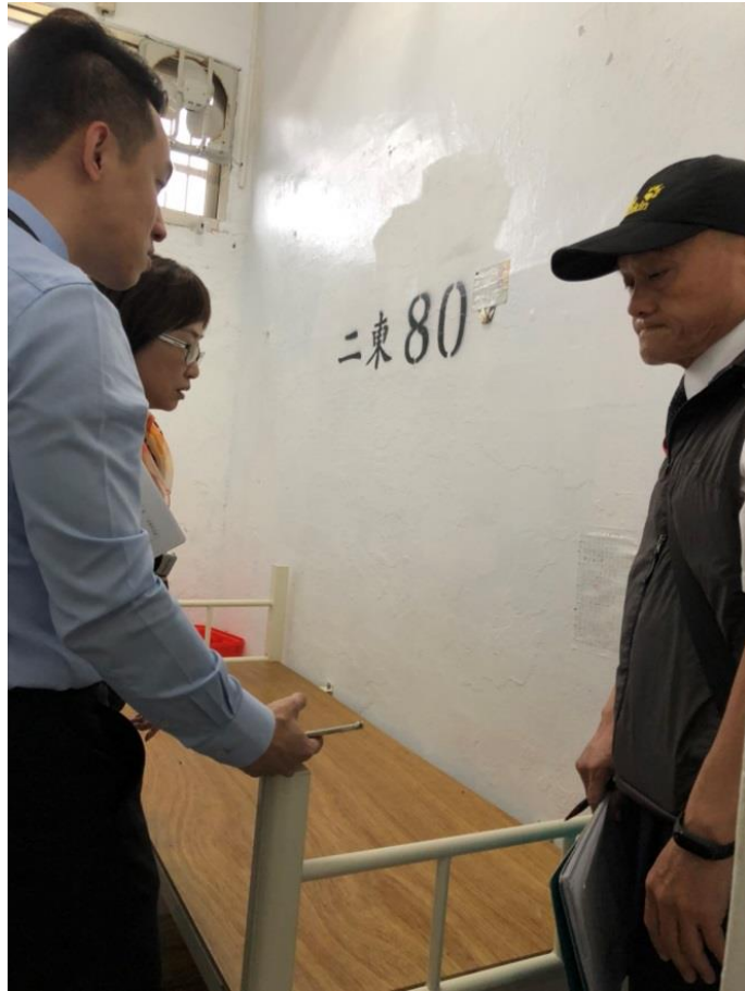
照片1 本案調查人員履勘綠島監獄獨居舍二東舍80號房

綠島監獄獨居舍二東舍80號房、二東舍72號房 (收容人0064吳○○108年3月6日自殺及自殺前 關押場所：1.5米長*3米寬之小牢房)