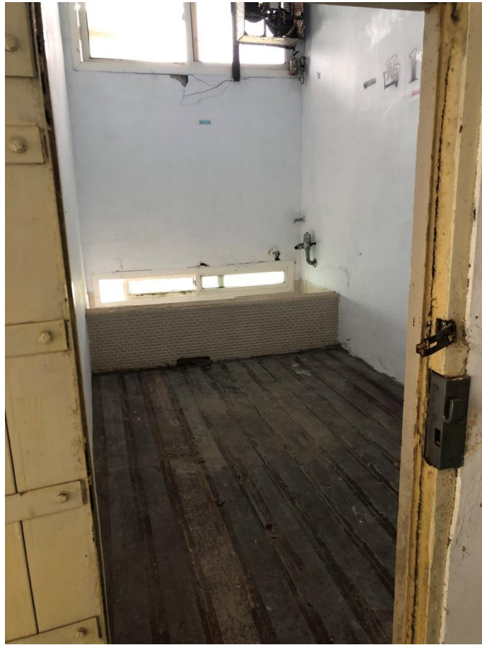
照片9 綠島監獄獨居舍內部情形