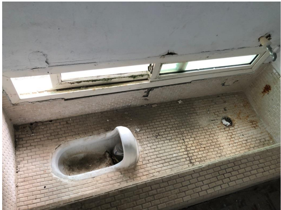
照片10 綠島監獄獨居舍內部廁所