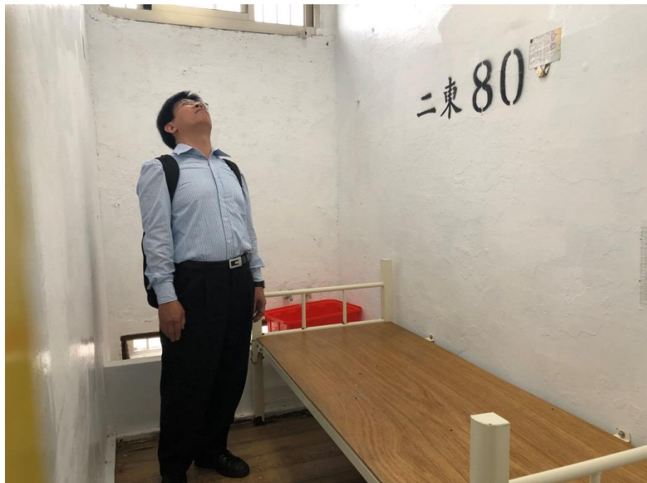
照片2 本院監察委員履勘綠島監獄獨居舍二東舍80號房