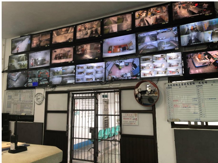
照片8 綠島監獄中央事務台戒護情形