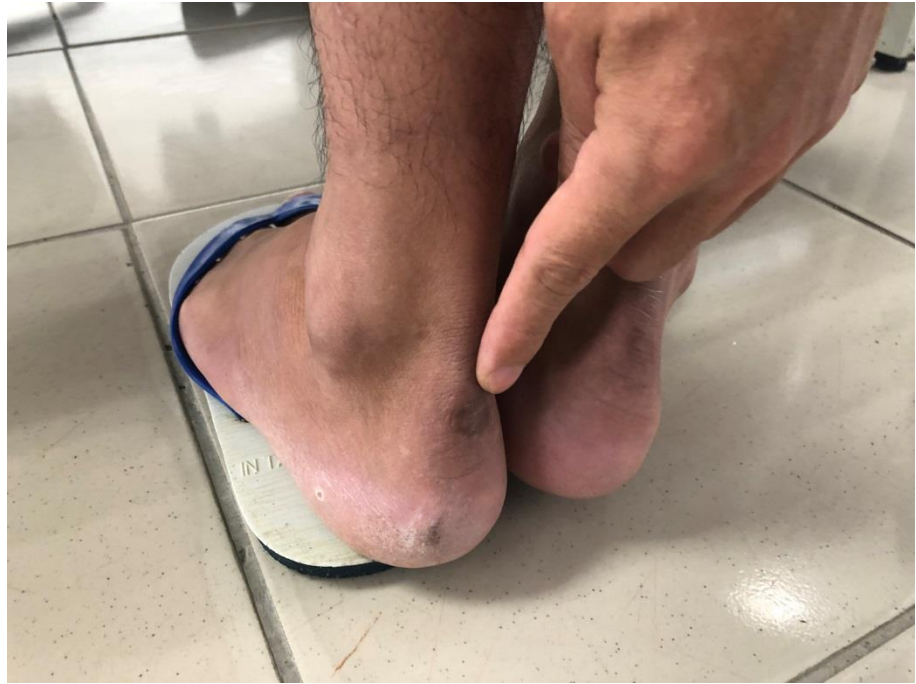
照片10 綠島監獄收容人遭上戒具後後腳跟皮膚磨傷情形