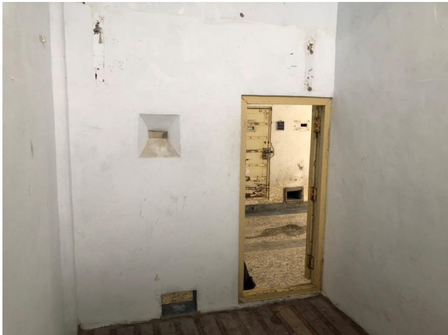
照片11 綠島監獄獨居舍內部情形