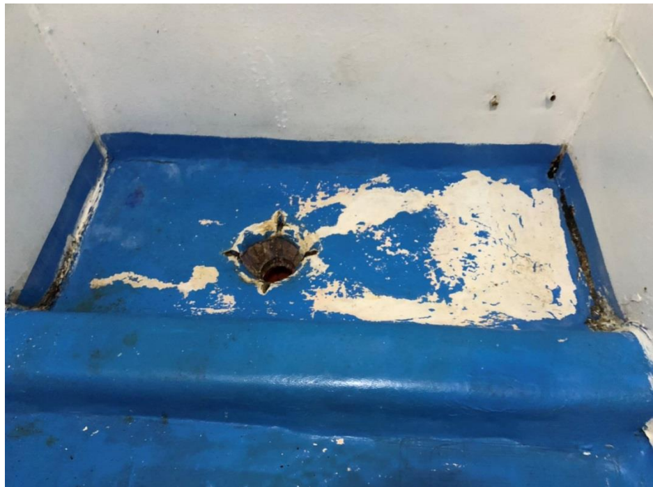
照片4 綠島監獄獨居舍二東舍72號房廁所照片