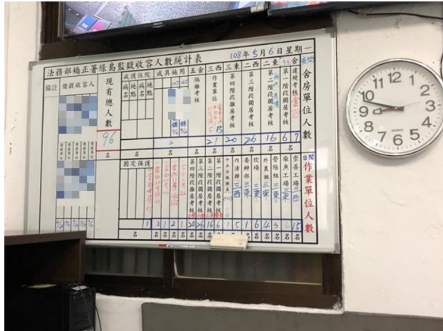
照片5 綠島監獄收容人數統計表

惟據本院調查人員108年5月6日上午8時48分蒐證資料顯示，除作業單位21人及第四階段雜居考核20人外，違規考核及前三階段獨居考核人數，計有55人，達該監收容人數57%，與表3數據差距18人，相關數據、獨居舍房、獨居收容人放封區域照片如下：