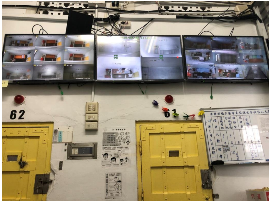
照片7 綠島監獄獨居舍戒護情形