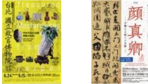
圖2 2014年「臺北 國立故宮博物院—神品至寶」海報圖示(左)與2019年「書聖之後—顏真卿及其時代書法」海報圖示(右)比較圖

宮全銜因字體較大故較易辨讀，而2019年「書聖之後—顏真卿及其時代書法」之海報圖示，因字體過小，於該網頁則難以辨識，詳如下圖：