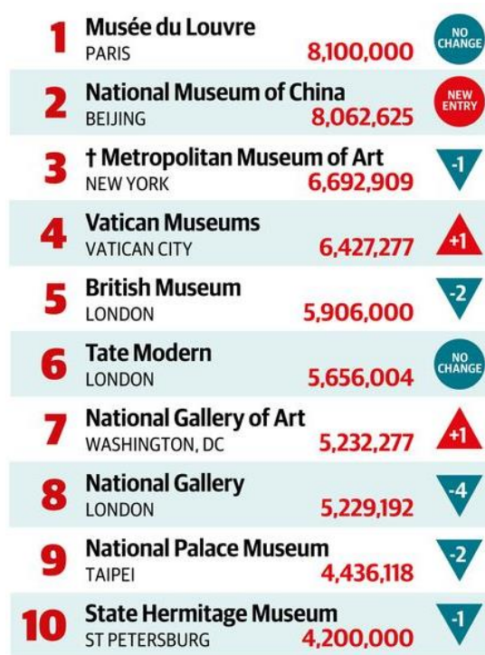
圖3 藝術新聞報《觀眾人次2017》The Art Newspaper: Figure 2017