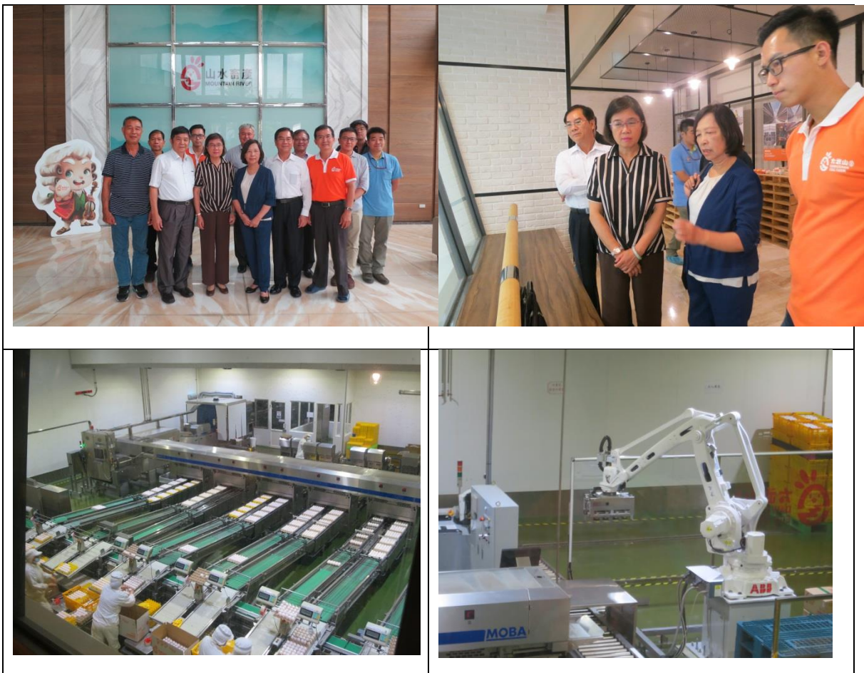
圖8. 本院於7月1日再赴屏東縣實地履勘現代化蛋雞場。

(2) 蛋雞場：「萬一碰到產銷失調，品牌蛋契作居多，會比較穩定，也不會過剩，傳統蛋就必須透過共體時艱或是進口來調整。」