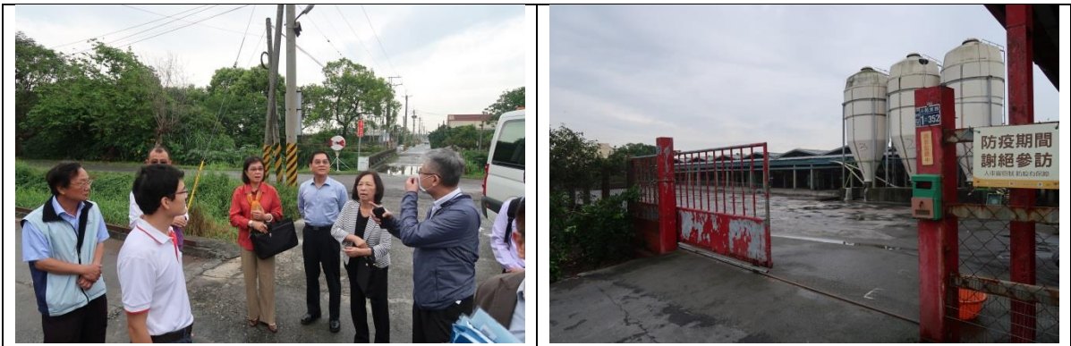
圖7. 本院赴彰化縣實地履勘蛋雞場。