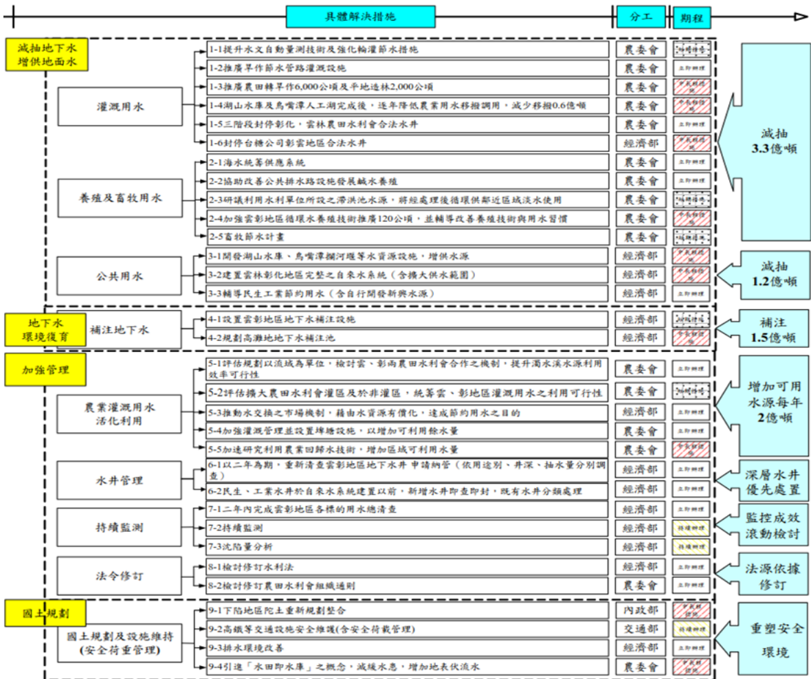
附圖二、雲彰行動計畫量化目標示意圖