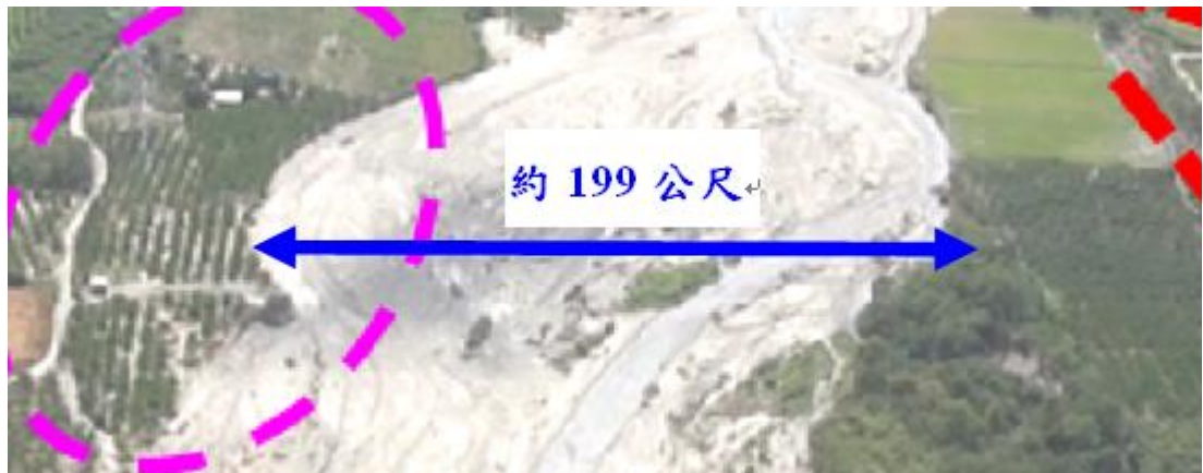
臺東縣太平溪南王橋至太平橋間農地沖毀前後影像圖

(四)前述臺東縣政府辦理之「太平溪(太平橋上下游)河川疏濬清淤工程」，堆置 30 萬 1,671 立方公尺於太平橋下游右岸高灘地（太平橋與南王橋間、河川區內），據該府資料顯示，該斷面河寬約 290 公尺，堆置區寬度約 130 公尺，河道寬度僅餘 160 公尺，不符規劃報告所述該河段需 200 公尺至 450 公尺寬，況此寬度範圍係 75 年即已認定，98 年辦理規劃時再次確認，該府辦理疏濬工程未將土石清運至河川區外，有違經濟部核定之規劃報告內容，實有不當。