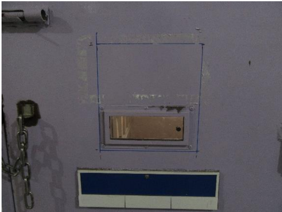
圖4 臺北看守所忠二舍4號房瞻視孔外觀（案發時）