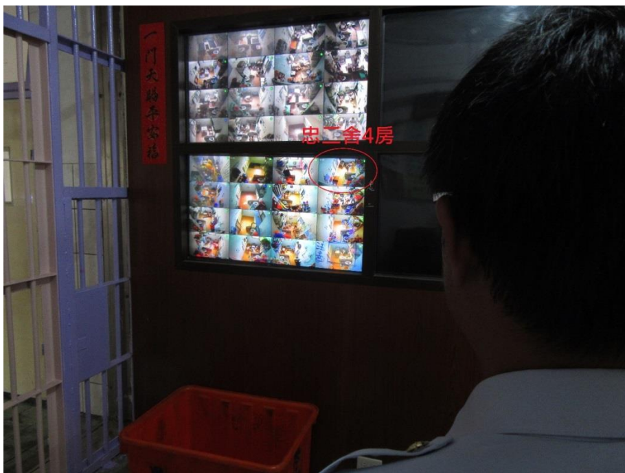
圖5 臺北看守所忠二舍戒護人員觀看監視器畫面視角