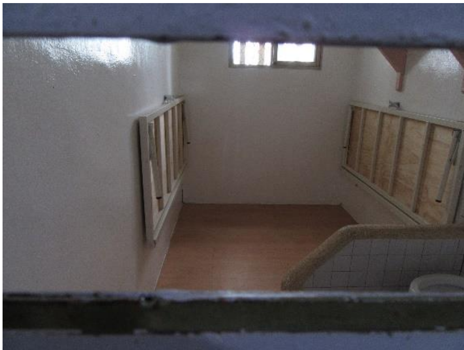
圖3 臺北看守所忠二舍4號房瞻視孔向舍房內視角（案發時）