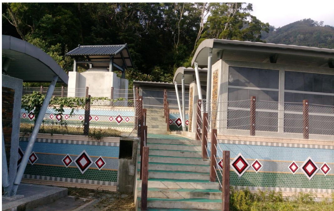
照片 2、復興區霞雲里原住民族示範公墓納骨牆