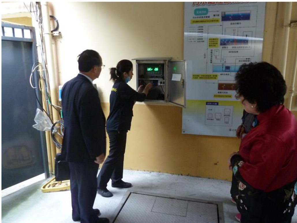
照片 2、第二殯儀館相驗暨解剖中心大體重量測量儀器