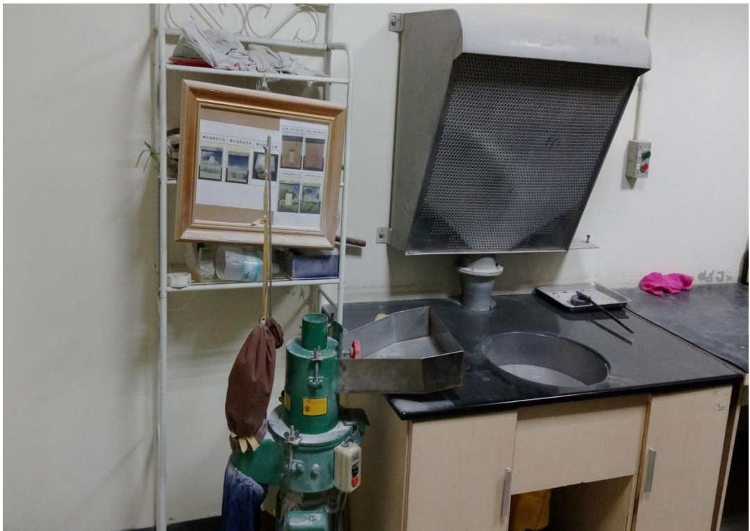
照片 4、新北市立殯儀館附設三峽火化場之骨灰再處理設備