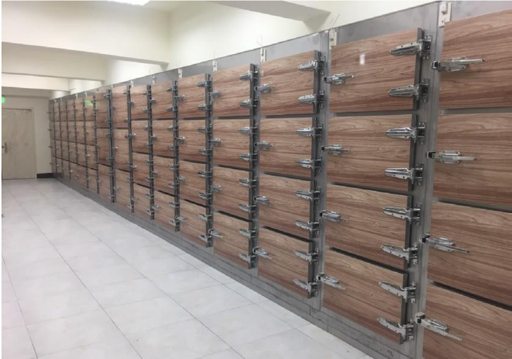
照片 1、新北市立殯儀館更新之冰櫃