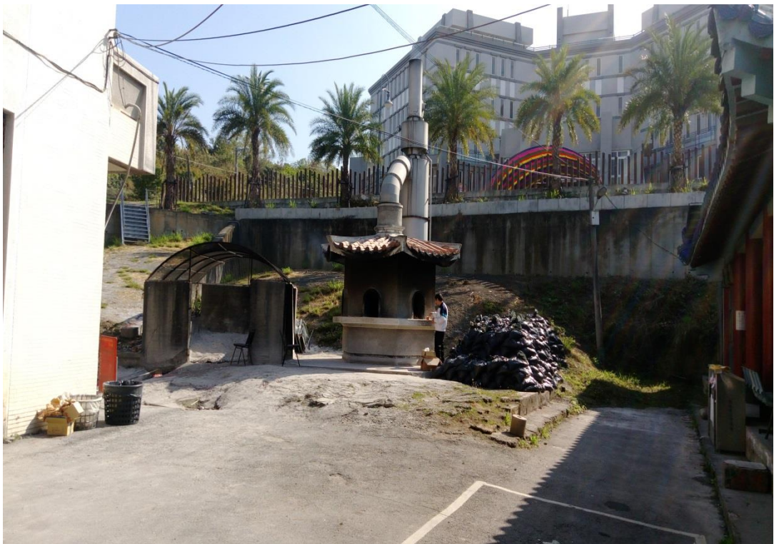
照片 2、彰化市立殯儀館區內設置燃燒庫(紙)錢之金爐