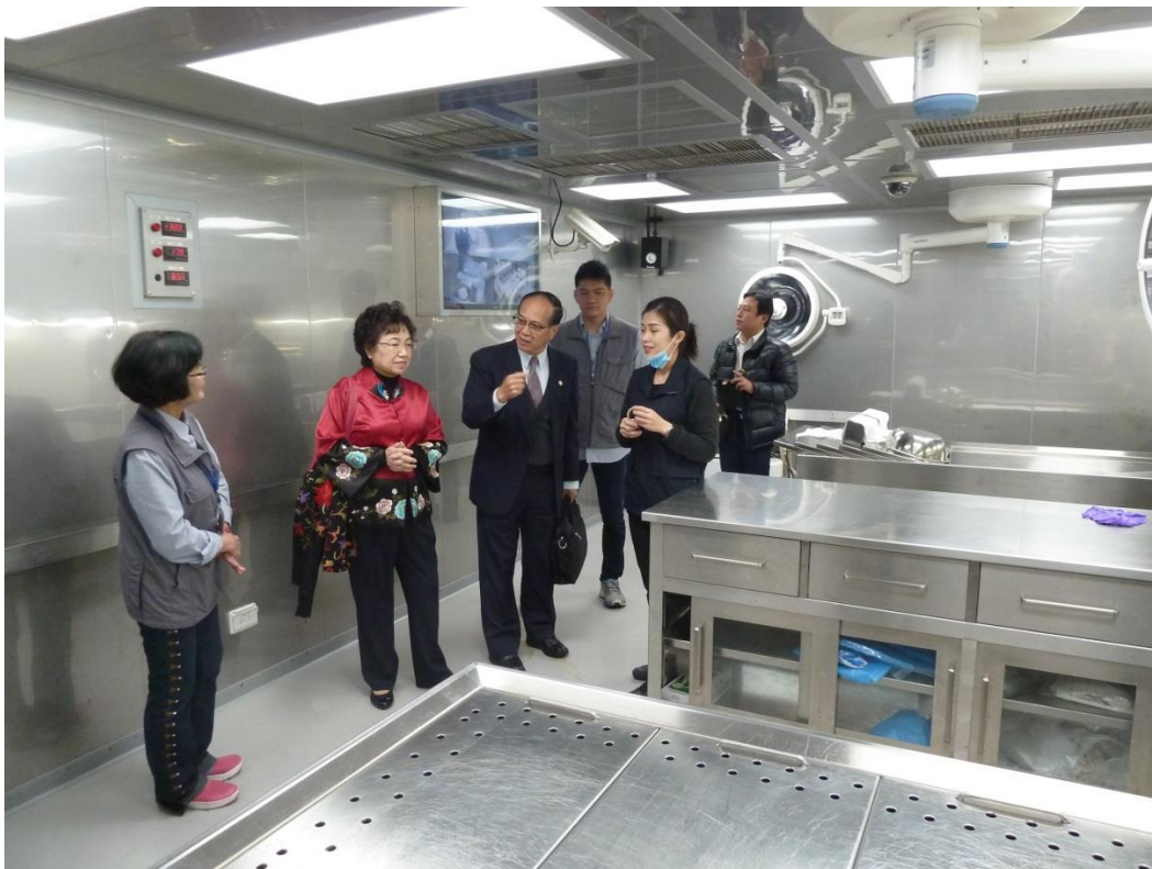
照片 4、第二殯儀館相驗暨解剖中心內部設備