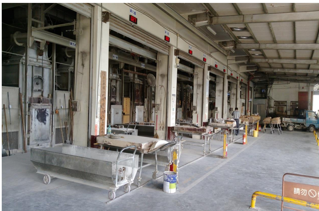
照片 2、集集鎮私立慈德寺火化場之火化爐設備