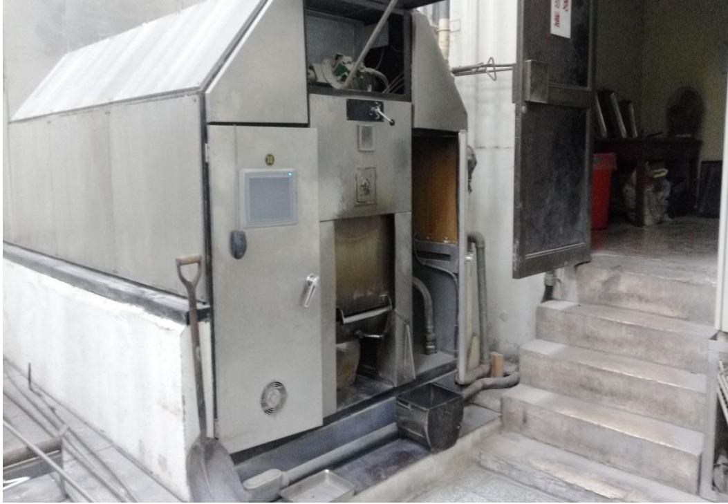
照片 3、新北市立殯儀館附設三峽火化場之火化爐(火化出口)