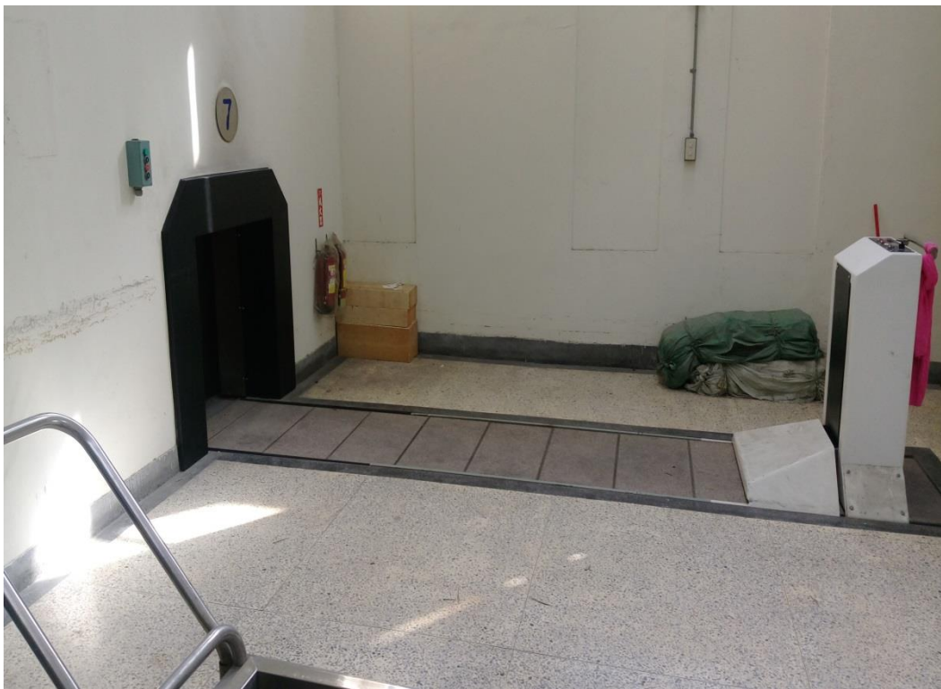
照片 2、新北市立殯儀館附設三峽火化場之火化爐(火化入口)