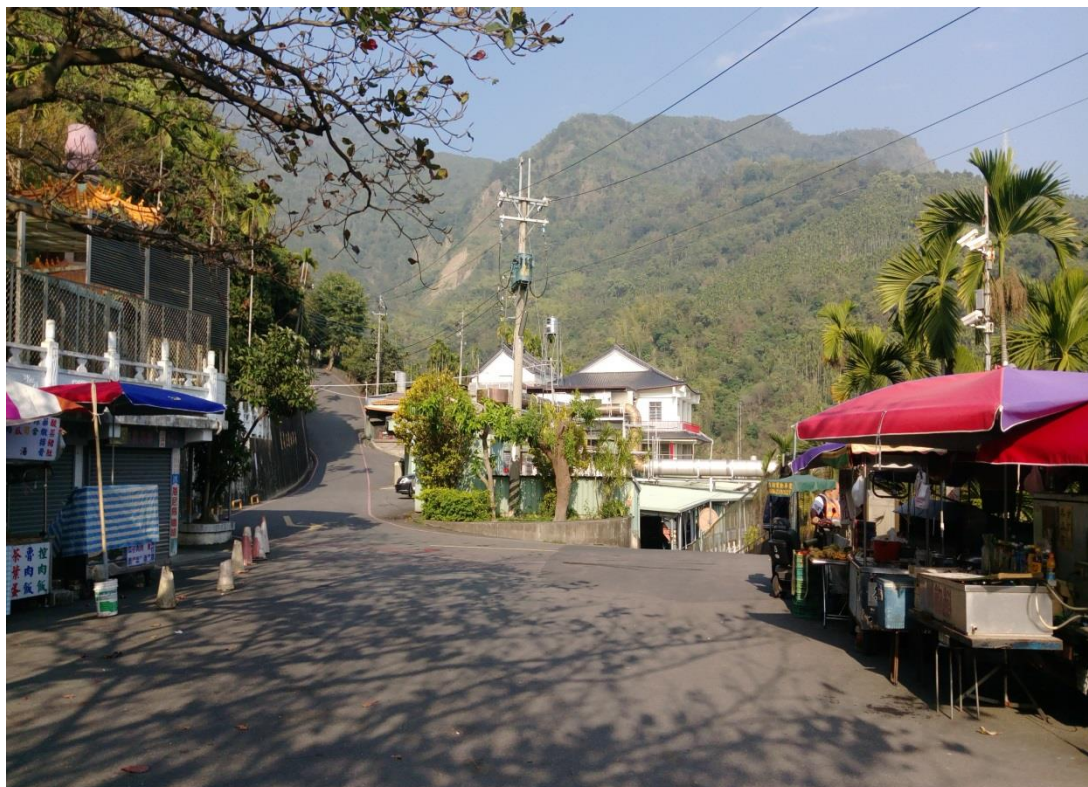
照片 1、集集鎮私立慈德寺火化場入口