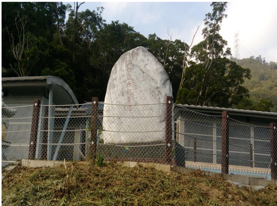
照片 1、復興區霞雲里原住民族示範公墓