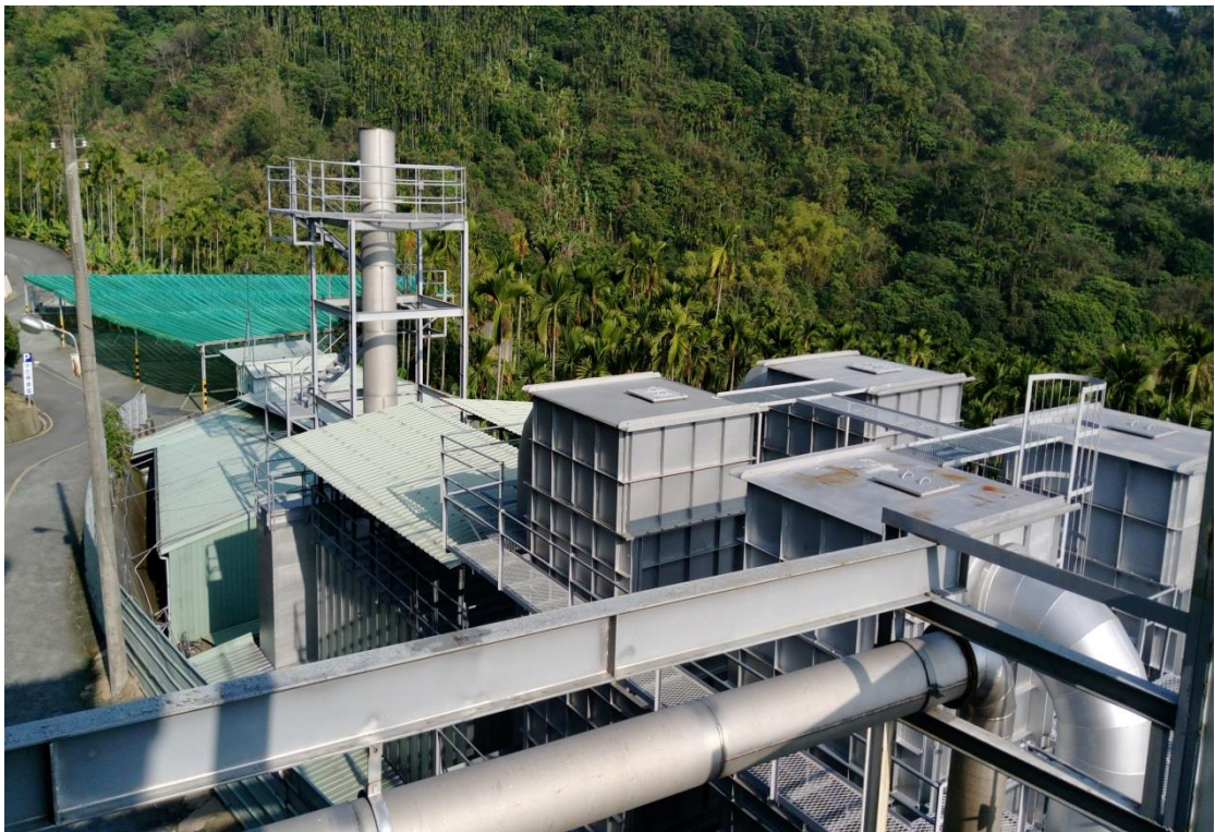
照片 4、集集鎮私立慈德寺火化場之空污設備