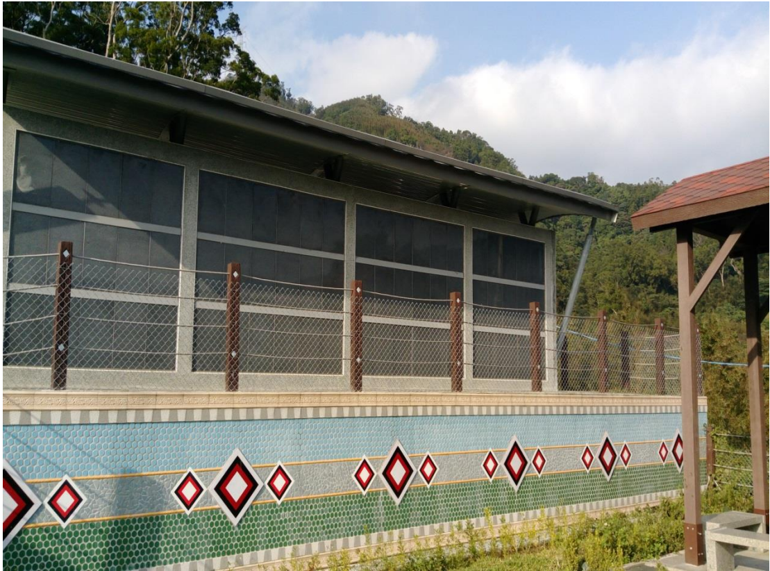
照片 3、復興區霞雲里原住民族示範公墓納骨牆