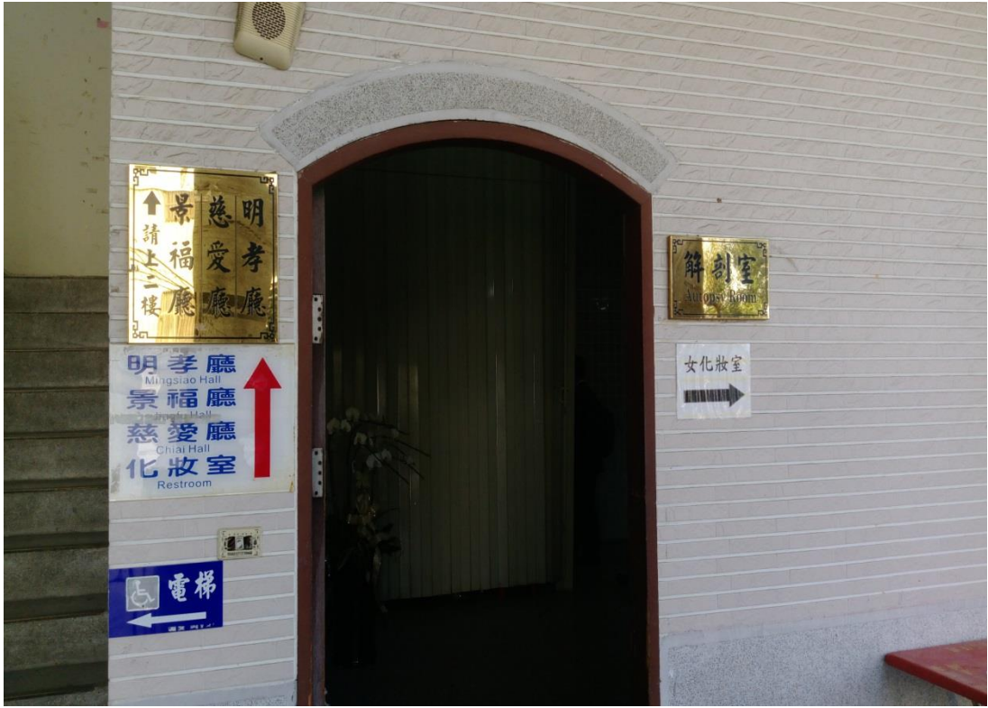
照片 3、彰化市立殯儀館解剖室外觀