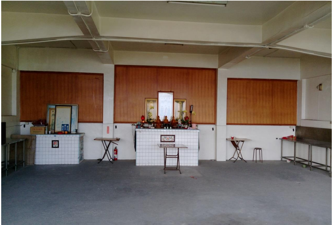
照片 3、集集鎮私立慈德寺火化場之內部設施