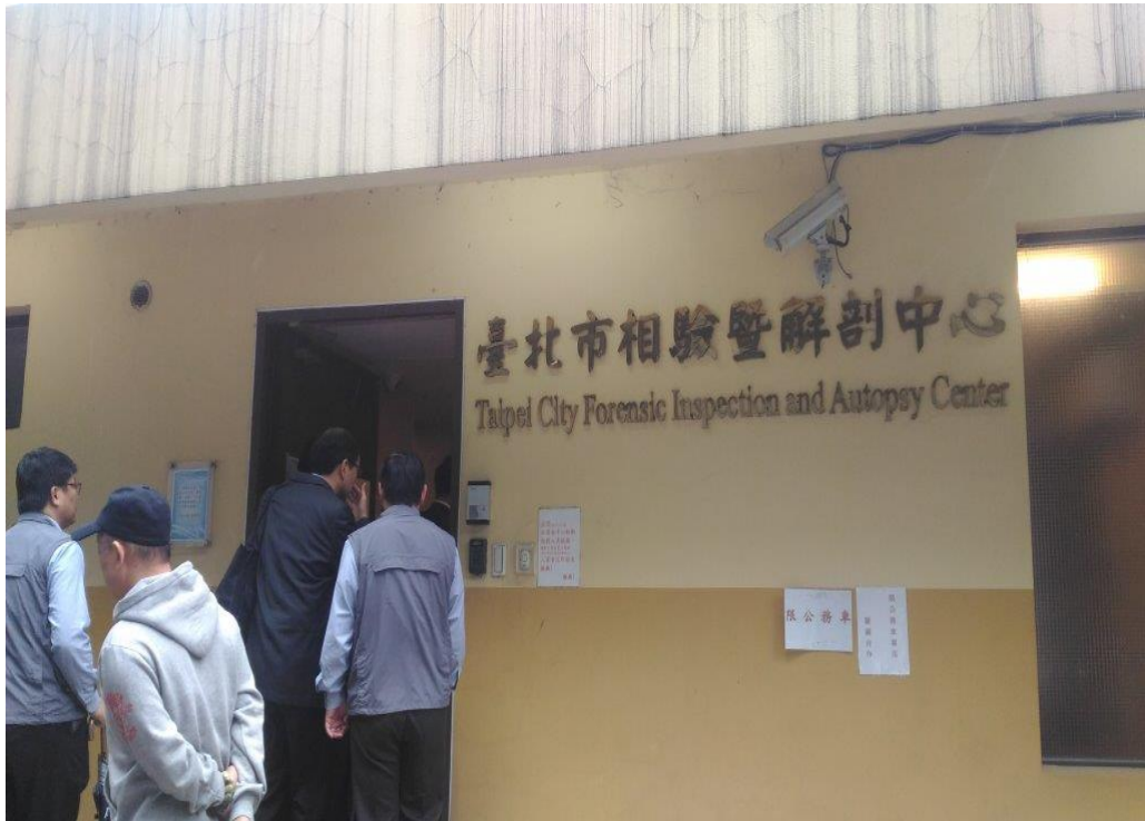
照片 1、第二殯儀館相驗暨解剖中心外觀