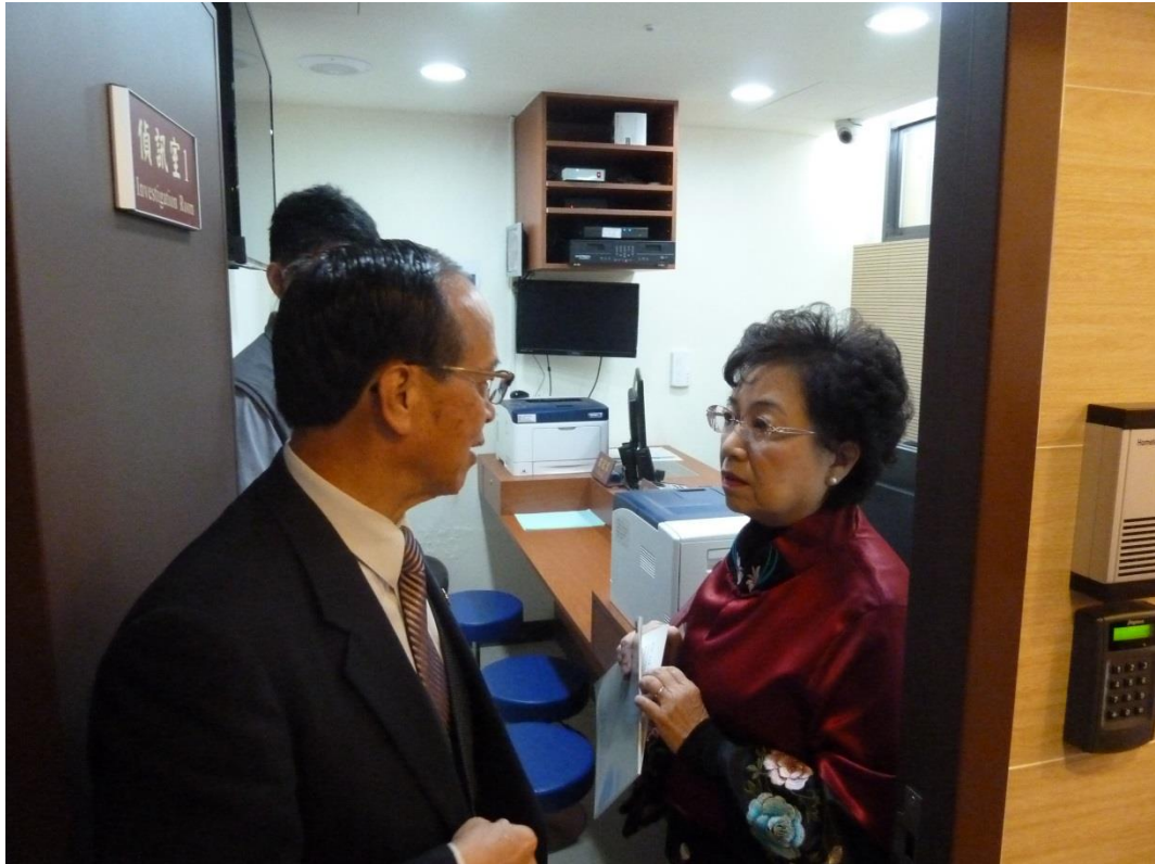
照片 3、第二殯儀館相驗暨解剖中心偵訊室