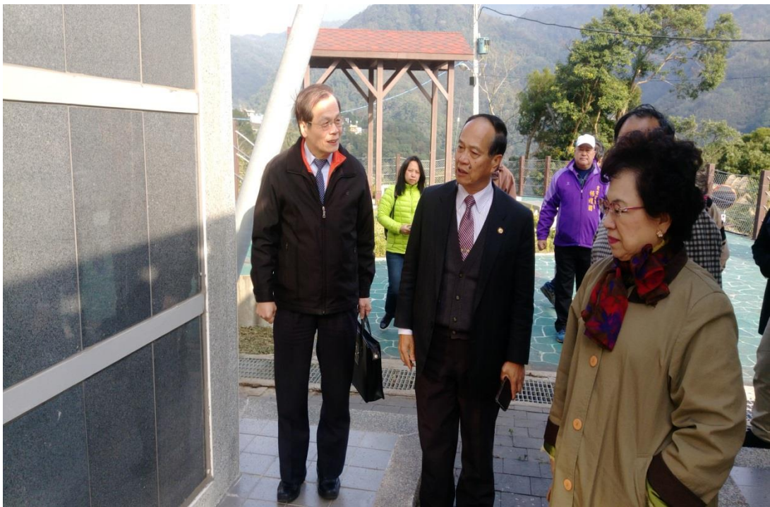
照片 4、復興區霞雲里原住民族示範公墓納骨牆