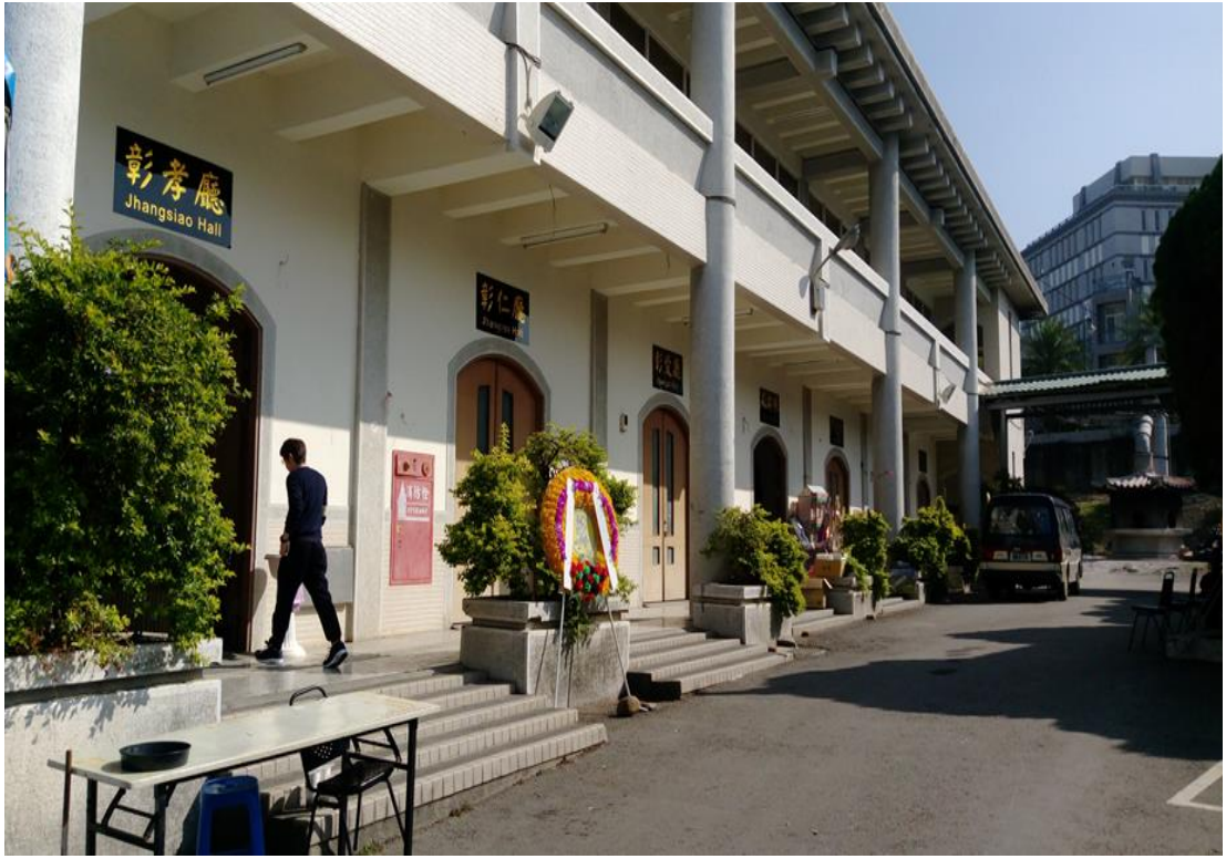
照片 1、彰化市立殯儀館