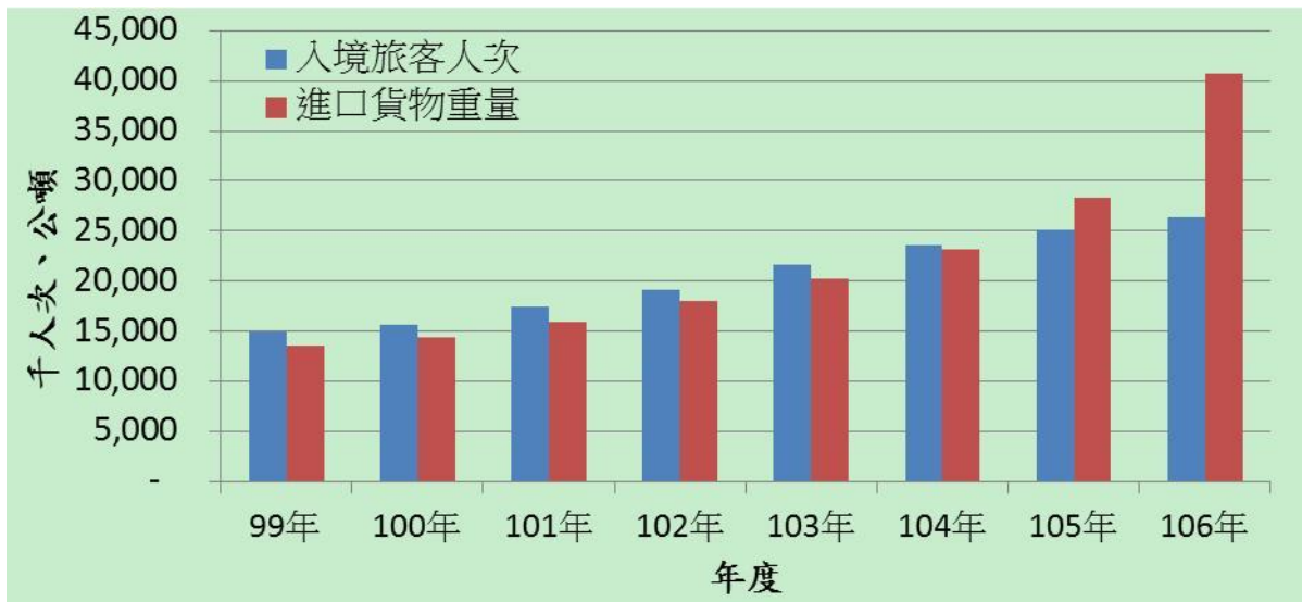
附圖一、歷年之入境旅客人次與進口貨物重量

(三)海關查獲進口貨物之毒品件數及重量，99年度查獲毒品件數是26件，至105年度已快速成長為137件，7年內遞增5.27倍；99年度查獲毒品重量是384.83公斤，至104年度已快速成長為4,427.84公斤，6年內遞增11.51倍，如附表二。