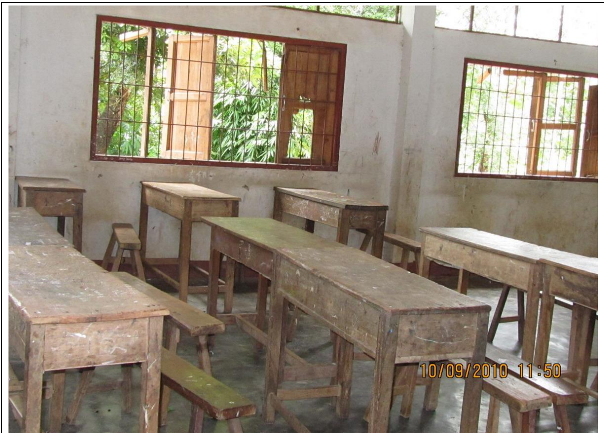
該校教室內情景，相關課桌椅、門窗皆已老舊或缺損，且屋瓦已破損；其他硬體設施尚缺電腦、影印機、音響、傳真機、投影機等。