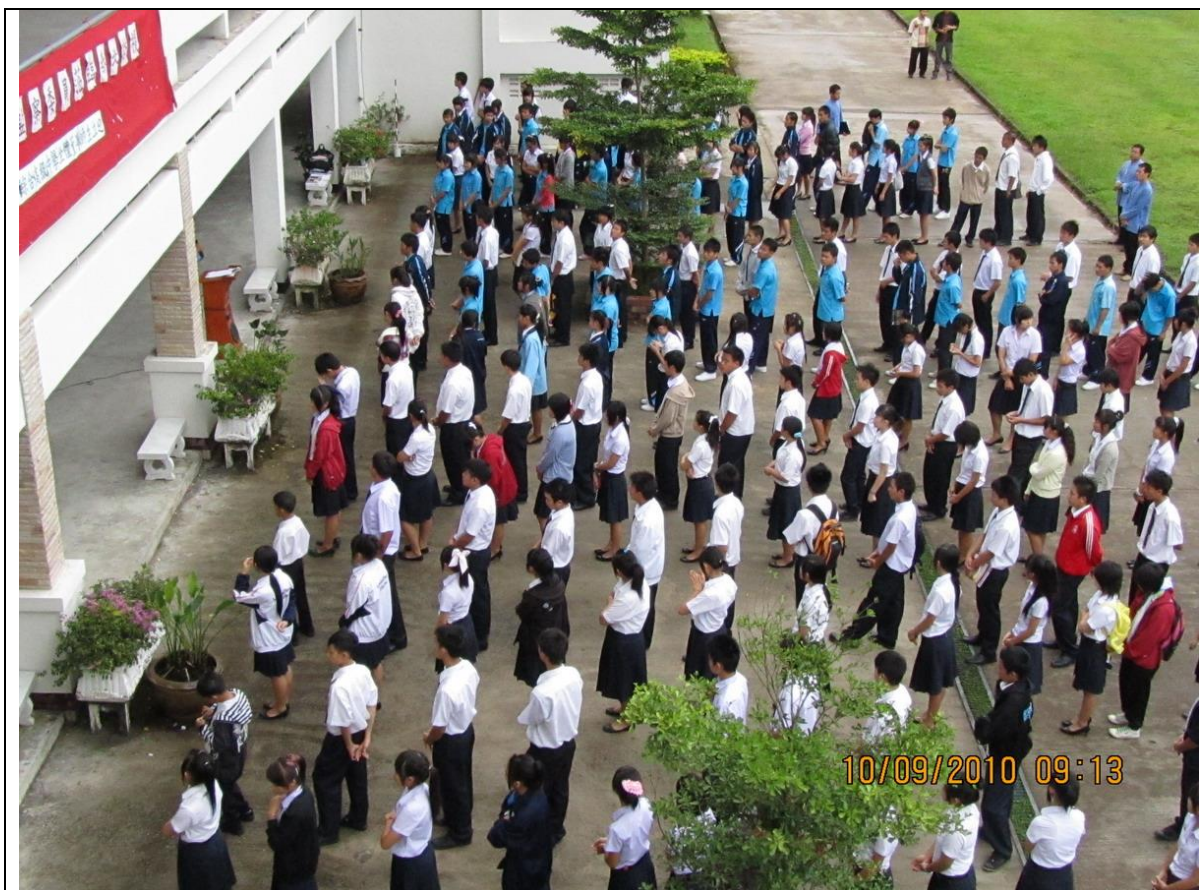
該校師生正於升旗早會，學生 363 人及聘任教師計 18 名(含校長)，設有商業、師範及資訊三科，為泰國核准立案之「高級中文部」。