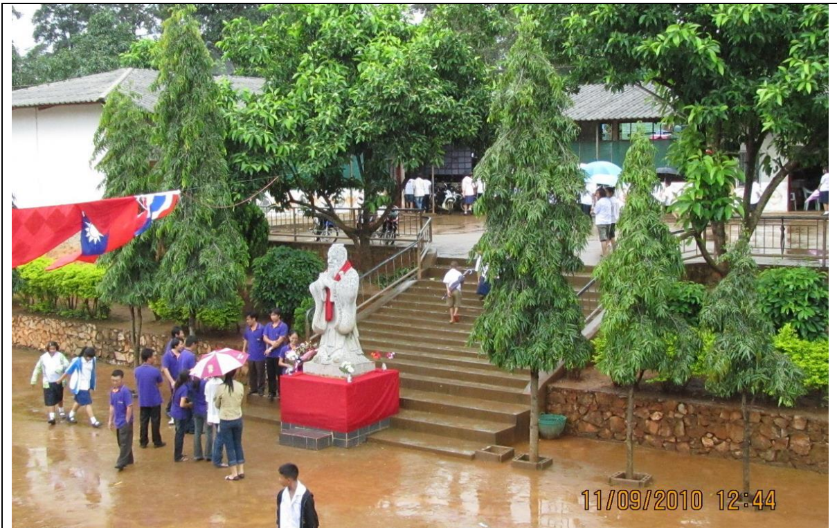
該校設有教室 49 間、電腦教室 1 間，操場旁矗立一尊孔子石像。