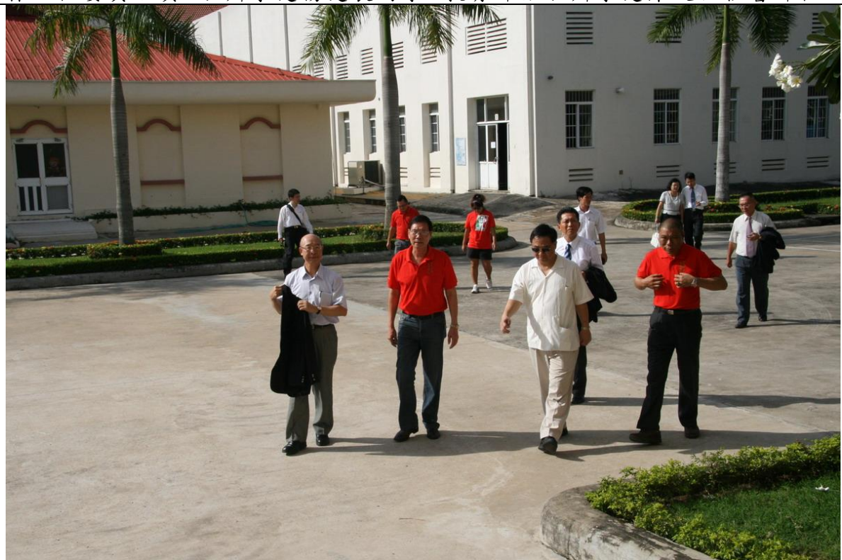
本案兩位調查委員訪查越南胡志明市臺灣學校校區。