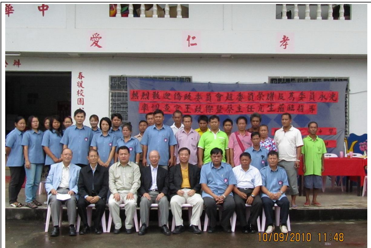
兩位委員與該校校長及教師等合照；該校師資、行政人員及校長皆由輝鵬村選派，教師多數為本地人，僅小部分來自中國大陸。