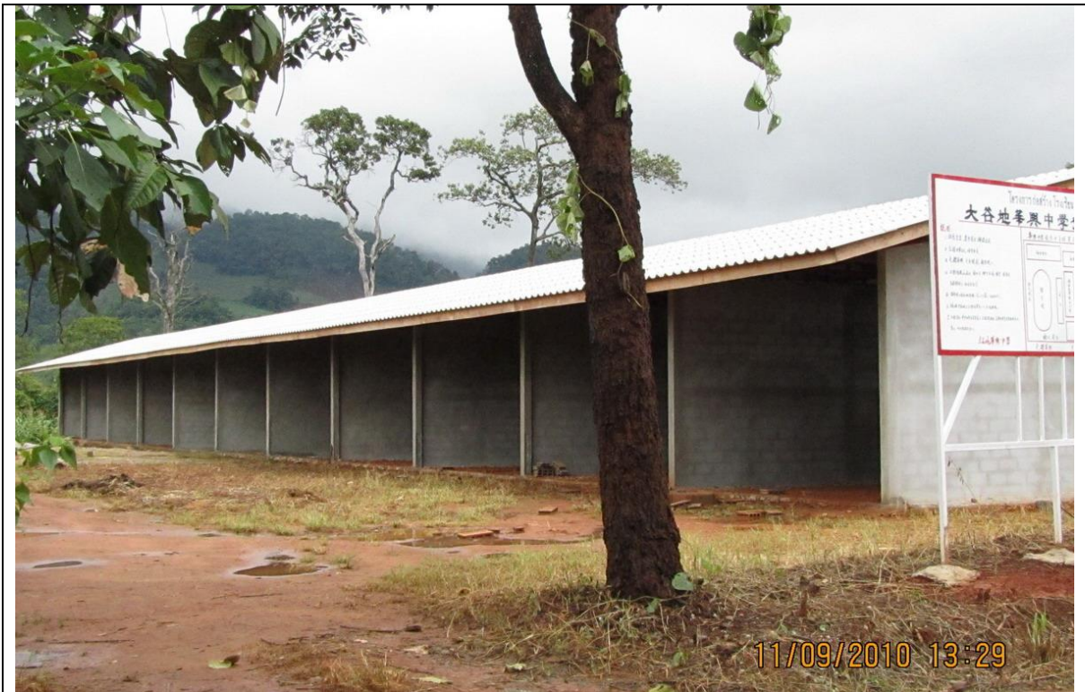
校舍分割為三處，之間約距離 1 公里之遙，未來將完成校舍統一，又學生人數逐年遽增，教室已顯不足，目前正興建新校舍 11 間。