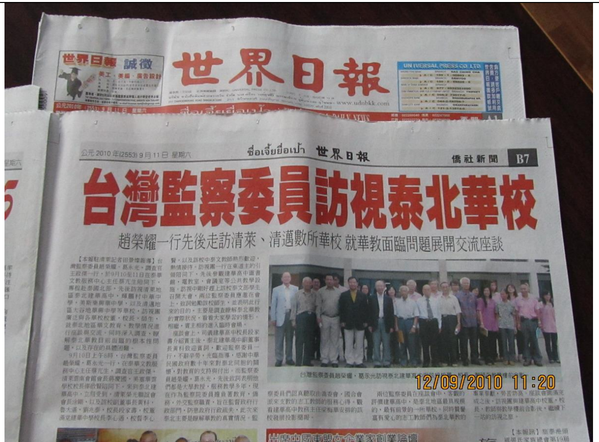
2010 年 9 月 11 日當地「世界日報」報導兩位委員訪視泰北僑校。