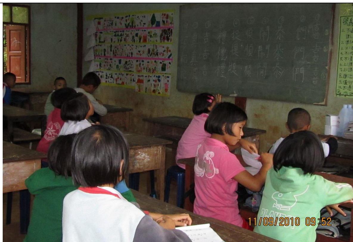
小學部上課情形，教室及課桌椅皆屬老舊；該校教師僅 9 人，且多為小學、國中畢業之當地村民擔任，學歷普遍不高，教學經驗不足。