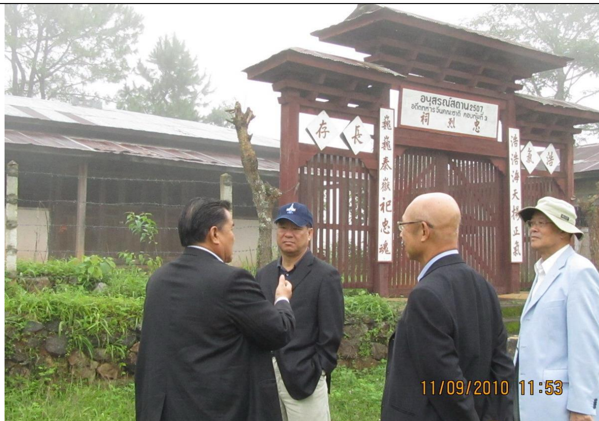
訪視唐窩村「雲南人民反共志願軍」第三軍軍部附近之忠烈祠。