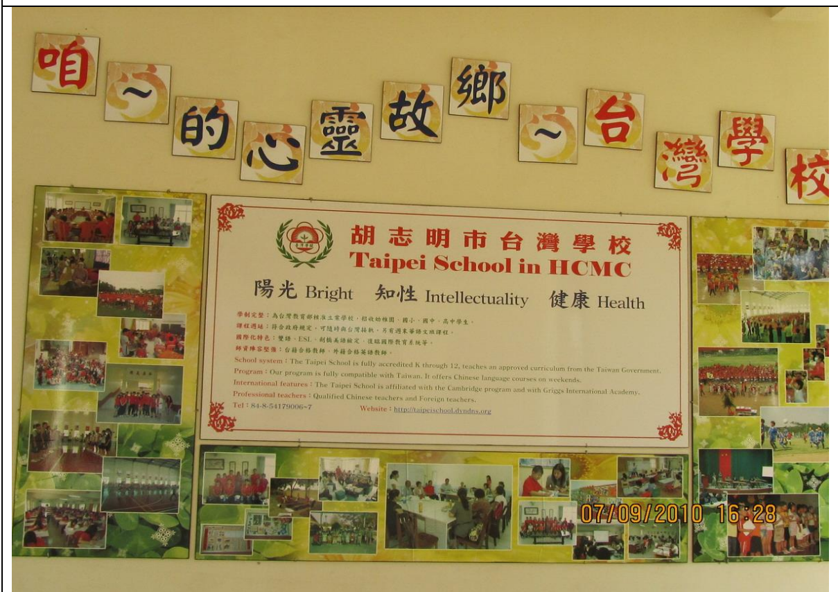
校內壁報，除註明學制外，並敘明辦學目標：陽光、知性、健康。