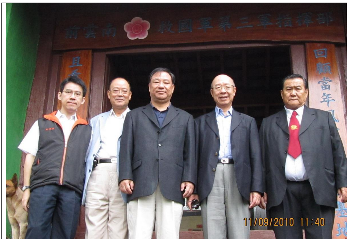
訪視當年「雲南人民反共志願軍」第三軍軍部，軍長為李文煥將軍。