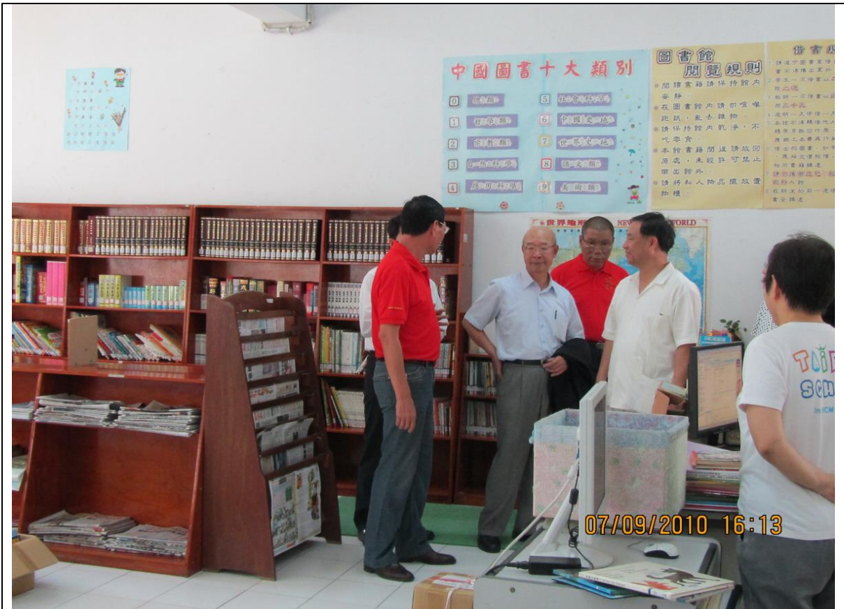
訪查越南胡志明市臺灣學校圖書館，當時圖書館藏書為 15,928 冊。