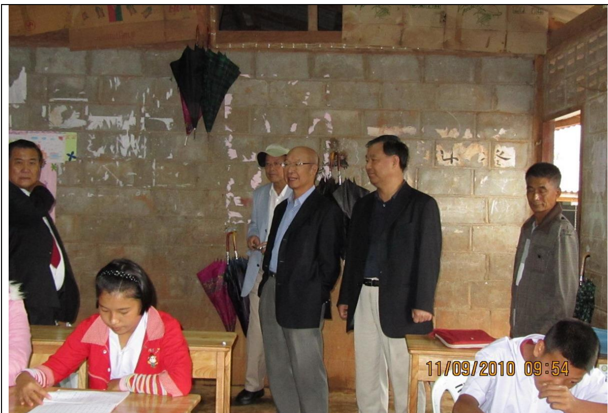
兩位委員訪查該校國中 1 年級學生上課情形，其使用之新購課桌椅，係僑委會於 99 年 1 月補助經費 3,000 美元，購置桌椅 100 套。