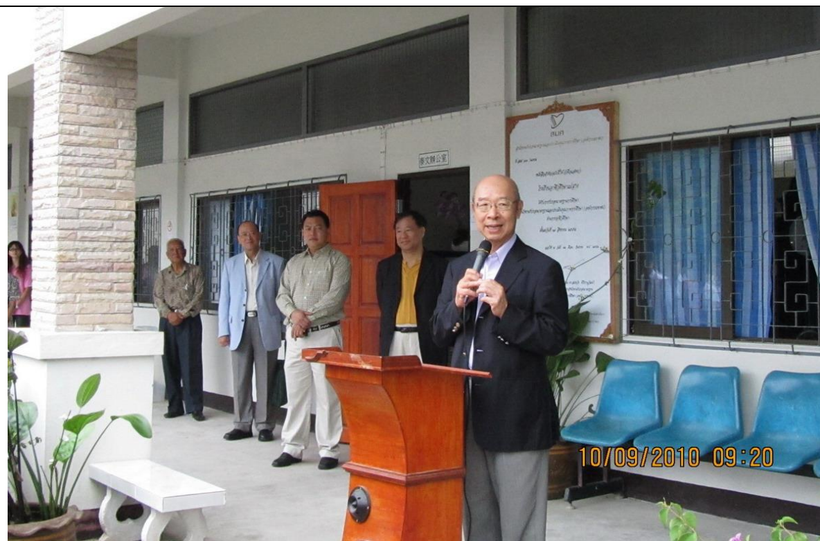
本院趙委員榮耀於該校早會中致詞，鼓勵學生未來可回臺升學。