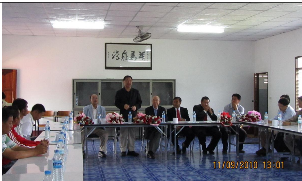
兩位委員聽取該校師生之辦學意見，瞭解部分家境清貧學生無法負擔學費，目前欠費生達 381 名，又經費、科任師資及教室不足。