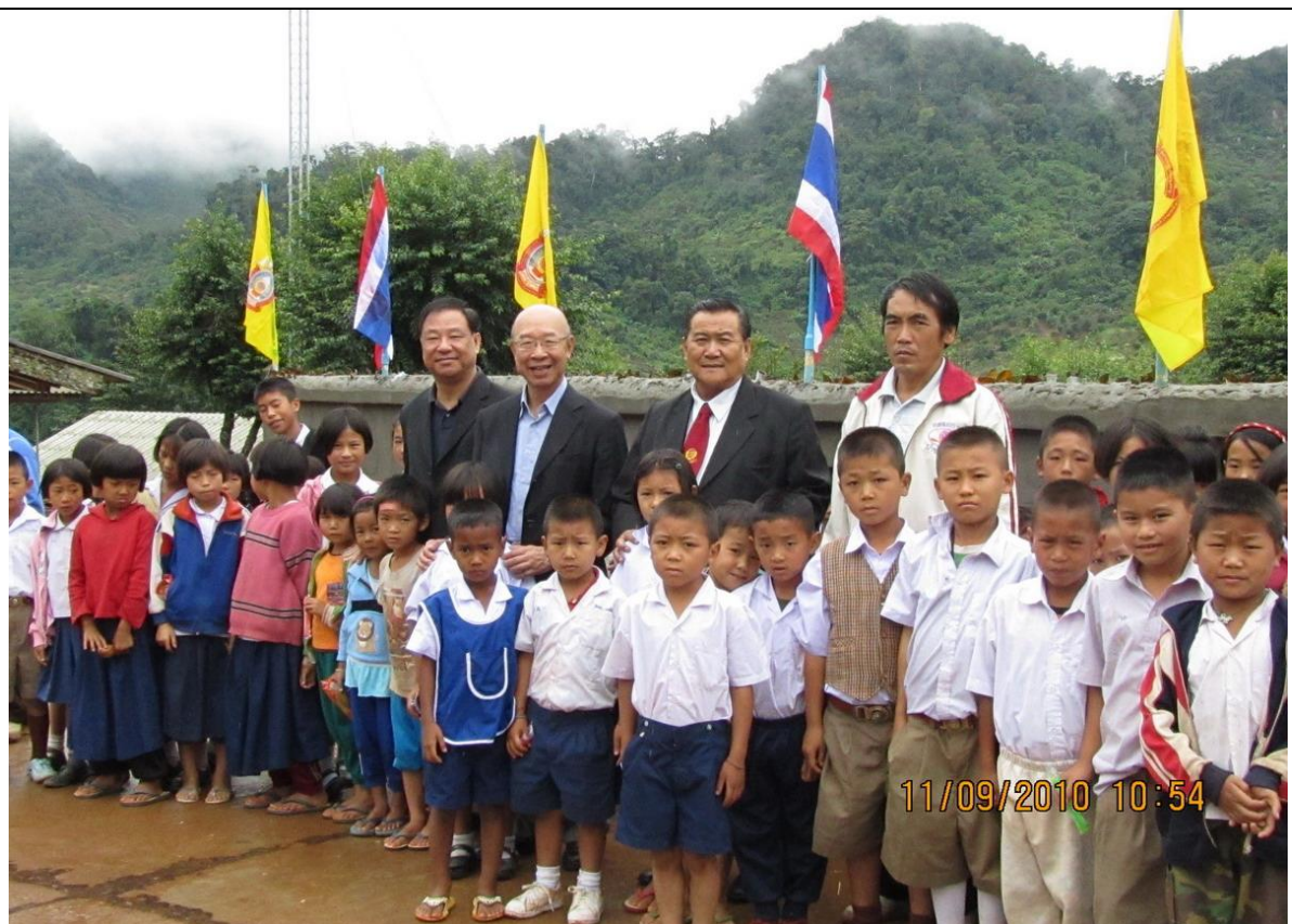
兩位委員於該校下課時間與學生們合照；學校經費源自學費及其他慈善機構捐助，學生每週上課6天，每天上課2節，每節50分鐘。