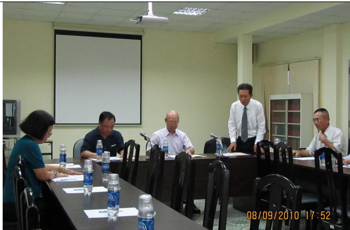
由辦事處楊處長進行僑務、商務、領務及急難救助等業務簡報，胡志明市臺灣學校亦接受辦事處輔導，教育部並派有文化秘書協助。