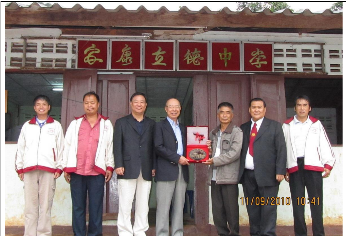
由王校長成方代表接受本院兩位監察委員所贈之監察院紀念銅盤。