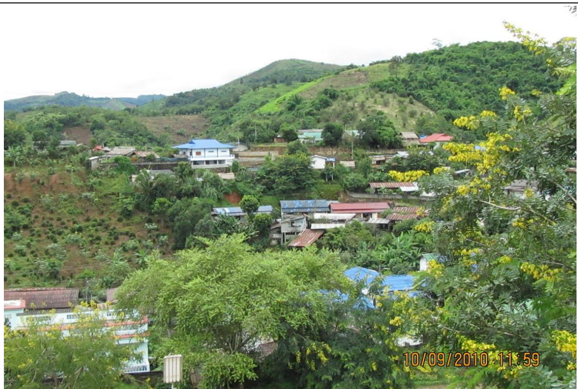
村民均為務農，收入微薄，部分家庭無法繳交學費，學校經費短缺，影響校務經營；目前每班學生約 70 餘名，尚足以支付教師薪資。