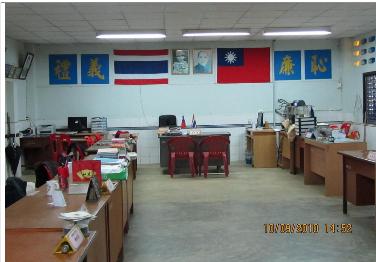
該校校長及教師等之辦公室；該校主科為：國語文、數學、英文。