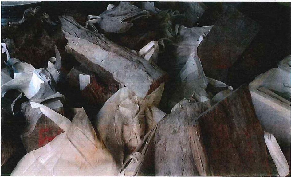
照片說明：本案牛樟木於東堤貯木場保管現況（拍攝日期：106.11.8）