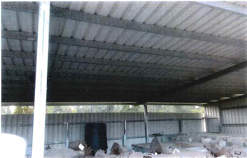
照片說明：本案牛樟木於東堤貯木場保管現況（拍攝日期：106.11.8）