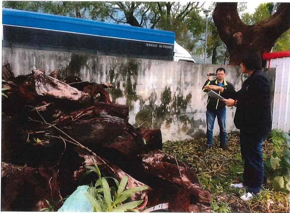
拍攝日期為 105 年 11 月 28 日