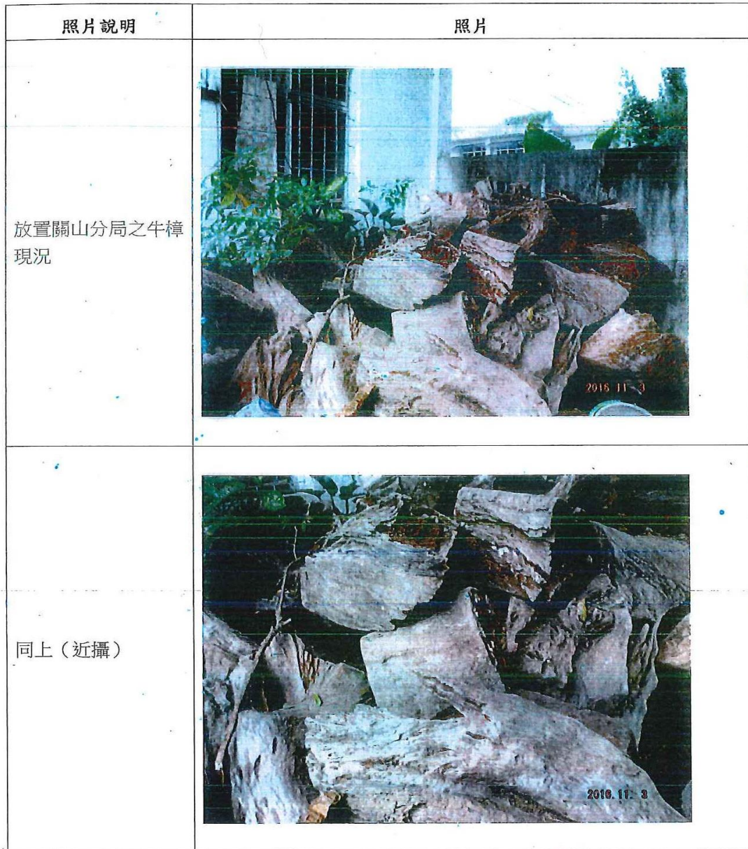
照片說明：查扣牛樟木放置於關山分局之情形（拍攝日期：105.11.3）