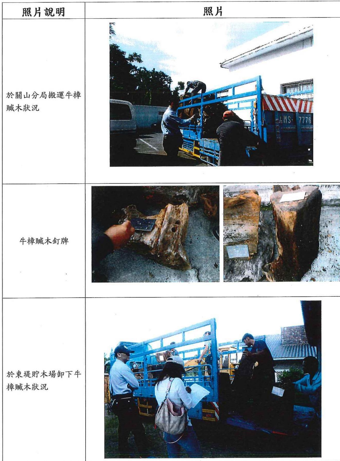
照片說明：會勘完成後運往東堤貯木場之情形（拍攝日期：105.12.5）