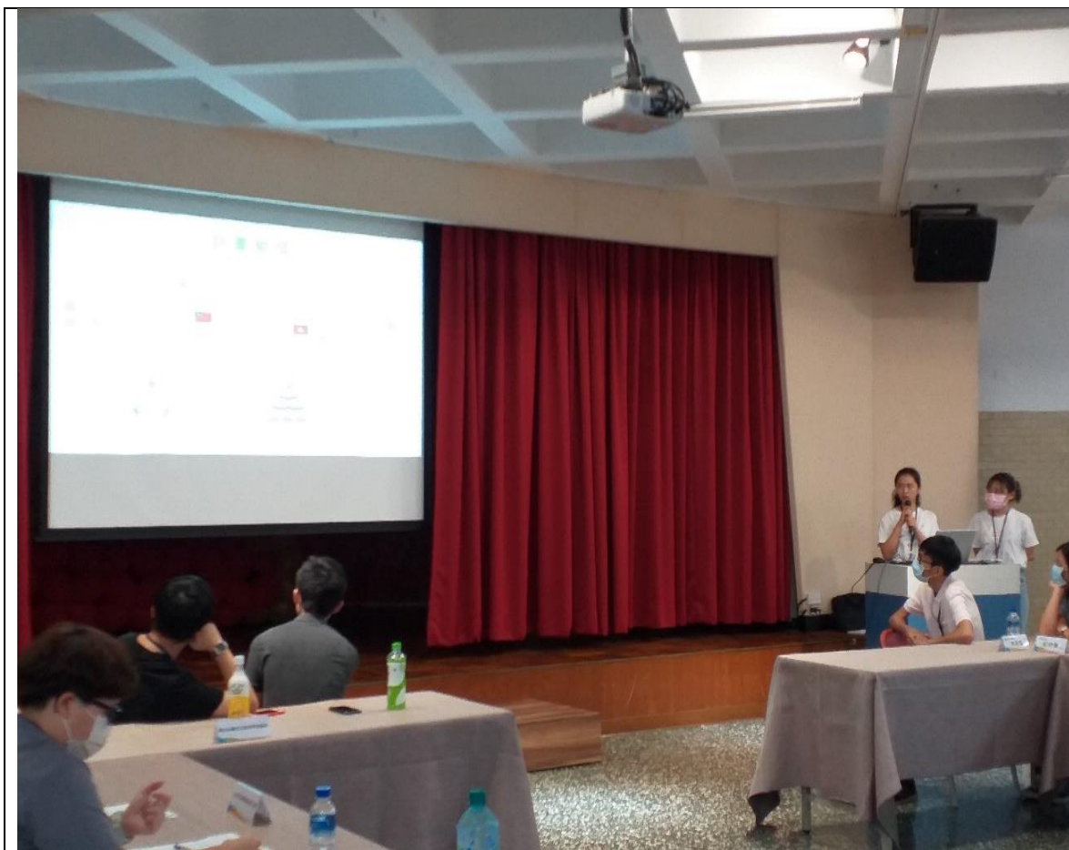
座談二：輔大越南織福志工服務隊經驗分享