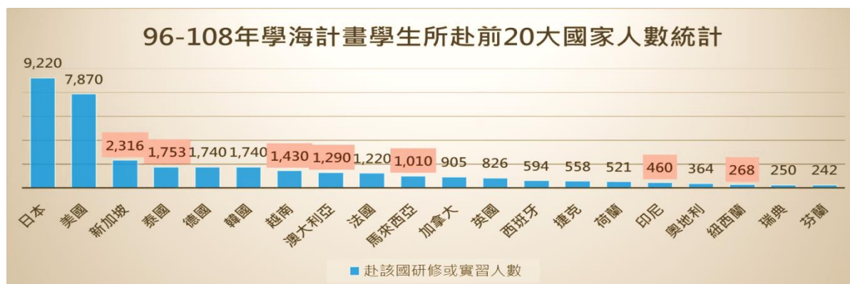
表7 學海計畫學生出國赴世界前20名國家人數統計

資料來源:教育部109年2月19日到院業務簡報書面資料。(統計時間自96年起至108年12月31日止)