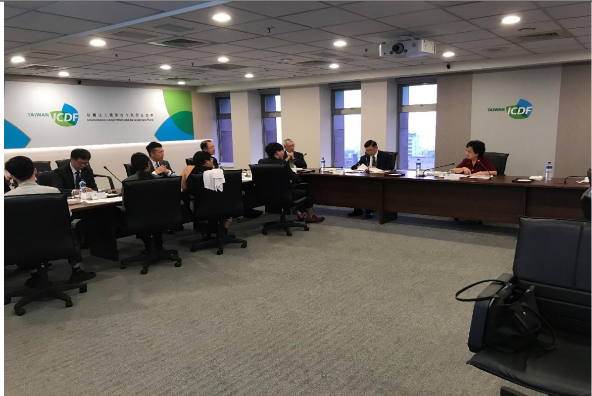
江委員綺雯、包委員宗和與外交部及國合會與會人員意見交流