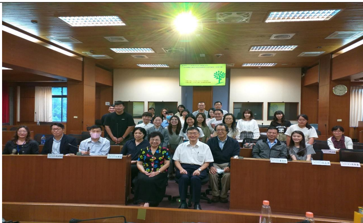
江委員綺雯、包委員宗和、青年署羅清水署長、教育部國際及兩岸教育司李世屏簡秘、教育部技術及職業教育司徐振邦專委等與文藻外語大學師生合影