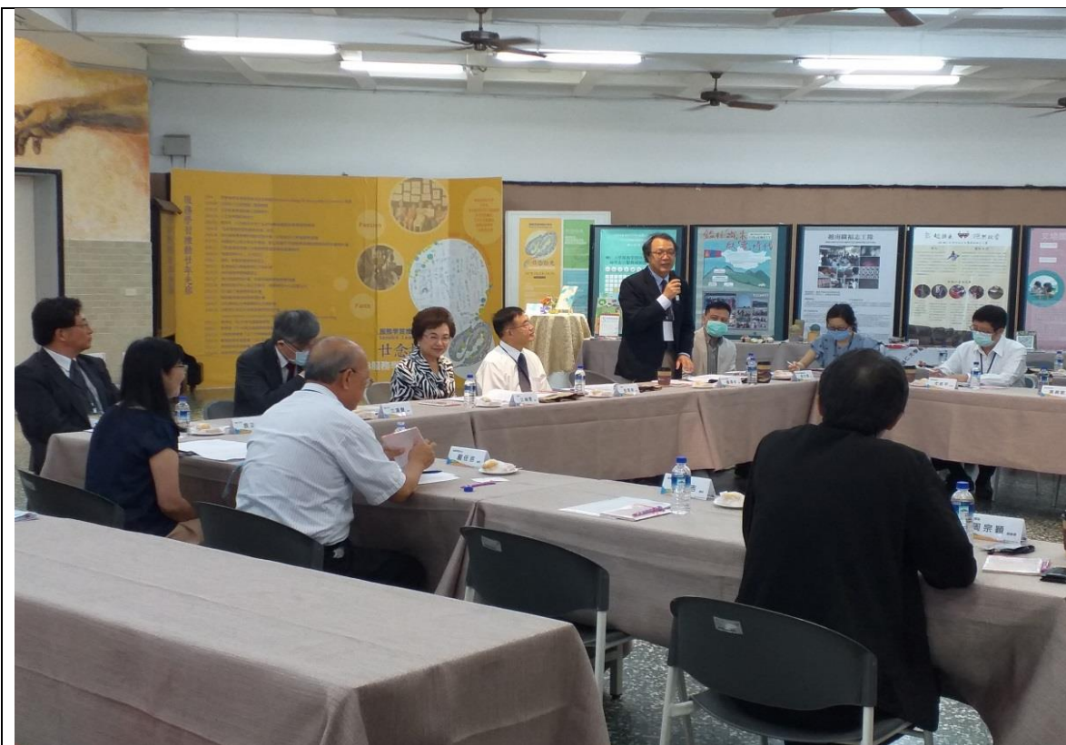
教育部青年署羅清水署長說明該署推動大專生海外服務學習業務。