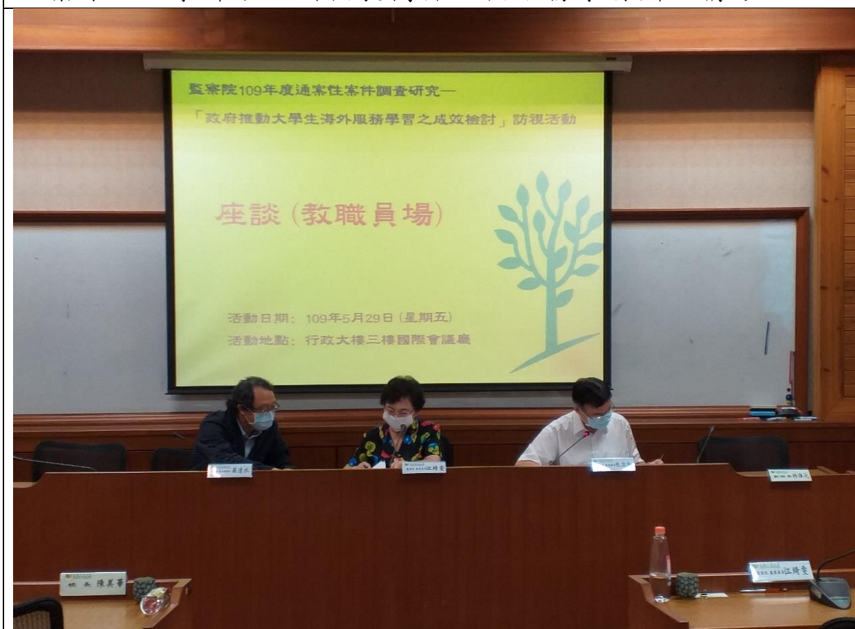
座談一:江綺雯委員、包委員宗和及教育部青年署羅清水署長與文藻外語大學教職員進行經驗分享與意見交流