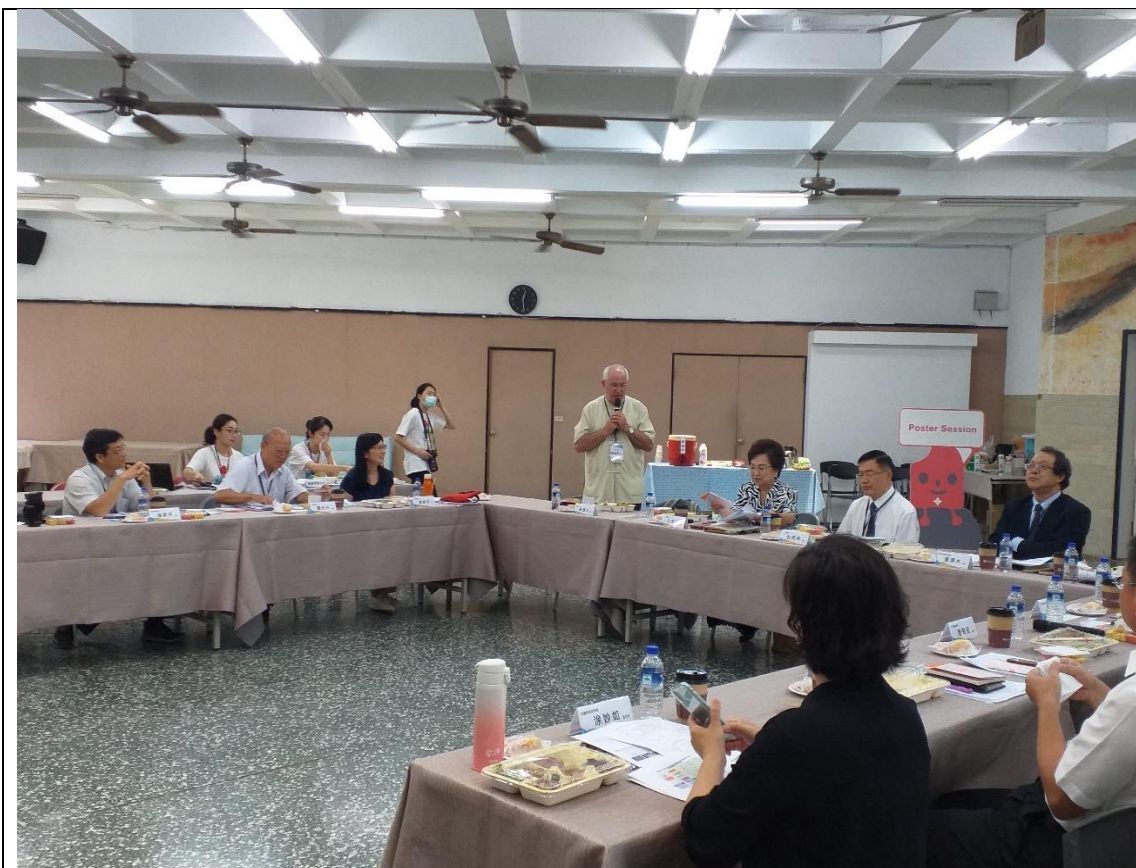
輔大聶達安使命副校長簡介該校服務學習辦理情形