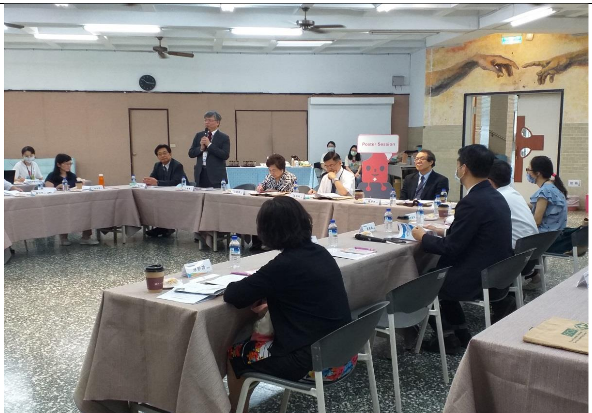
輔大江漢聲校長致詞