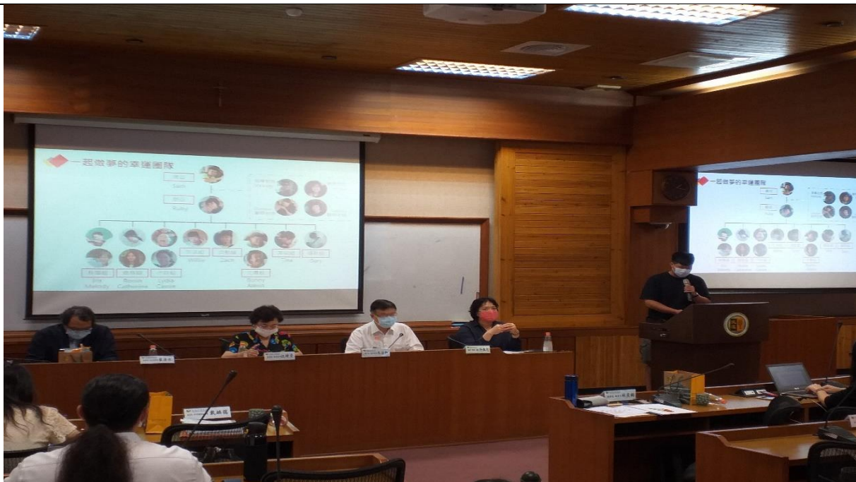
座談二：教育部USR「溫暖白色巨塔的小螺絲釘-文藻國際志工共創就醫無障礙」參與學生四技外語教學系鄧○偉經驗分享(柬埔寨)