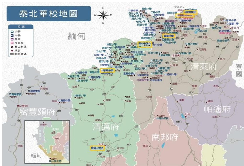
圖2 泰北地區僑校地圖

1、據僑委會函復 7 ，當地僑情特殊，我針對泰北地區僑務工作主要著重於僑教之推動；而在僑社方面，計有清邁雲南會館及清萊雲南會館2個僑民組織，泰北臺商同鄉聯誼會1個僑商組織，與我關係密切友好。另泰北地區104所僑校，分布於泰國清萊地區及清邁地區，清邁雲南會館及泰北臺商同鄉聯誼會位於清邁，清萊雲南會館則位於清萊。