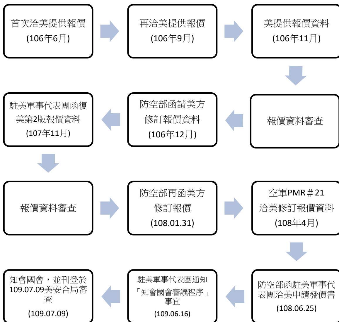
圖2、愛三重鑑案報價(修訂)、發價書需求信函遞交及知會國會審議情形

(二)防空部107年11月16日收到駐美軍事代表團提供第2版報價資料後，所屬後勤保修處(下稱後保處)先會辦作戰訓練處及主計處，並比照前版報價作業方式，於108年1月10日 10 再函請保指部協審，並依保