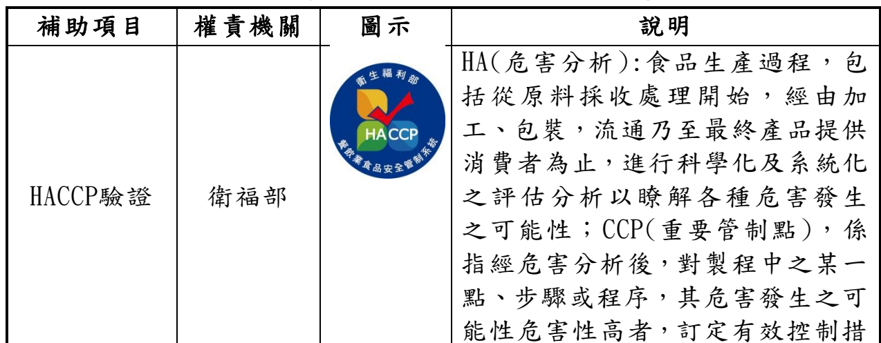
表12 旅宿業綠色服務計畫之補助項目、權責機關一覽表

(一)觀光局執行「旅宿業綠色服務計畫」，其補助項目可分為6大項，分由各機關管轄，衛福部危害分析重要管制點系統制度(Hazard Analysis and Critical Control Points, HACCP驗證)、環保署環保標章、內政部綠建築標章與防火標章、觀光局溫泉標章與星級標章。茲將旅宿業綠色服務計畫之補助項目、權責機關與說明整理，詳下表12。