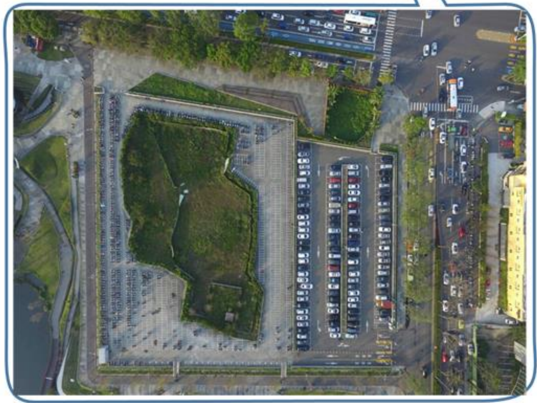
附圖 2 本案土地及周圍停車場與秋紅谷生態公園空照圖 (臺中市政府 105 年 4 月 7 日提供，↑:北)