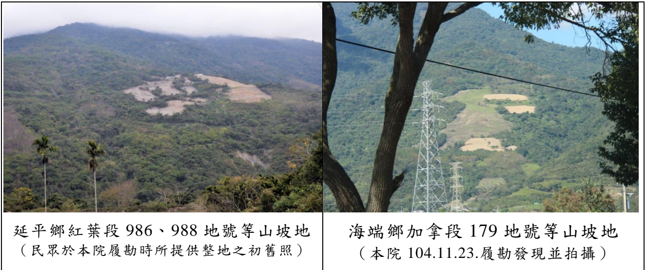
圖 1：臺東縱谷山坡地違規使用照片

(二)怠於行使水土保持核准案件之施工期間及完工之檢查職權，近 5 年來施工期間檢查比例僅為 0.48%，完工檢查比例僅為 33.84%：