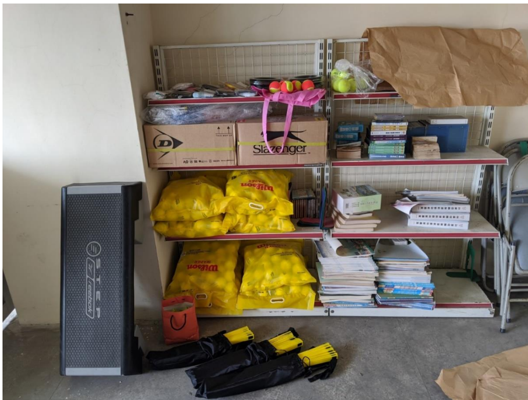
圖2 麗園國小活動中心3樓音控室，網球隊購置訓練器材置放情形(109年8月27日拍攝)