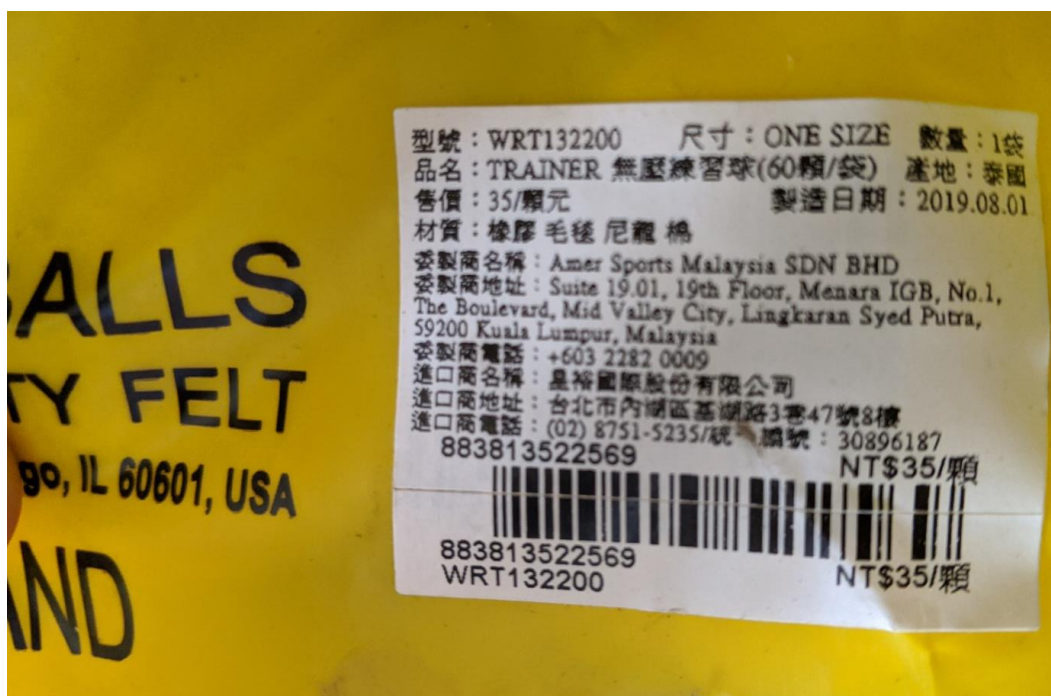
圖3 網球隊購置訓練器材之練習球8袋共480顆球，其製造日期為108年8月1日(109年8月27日拍攝)