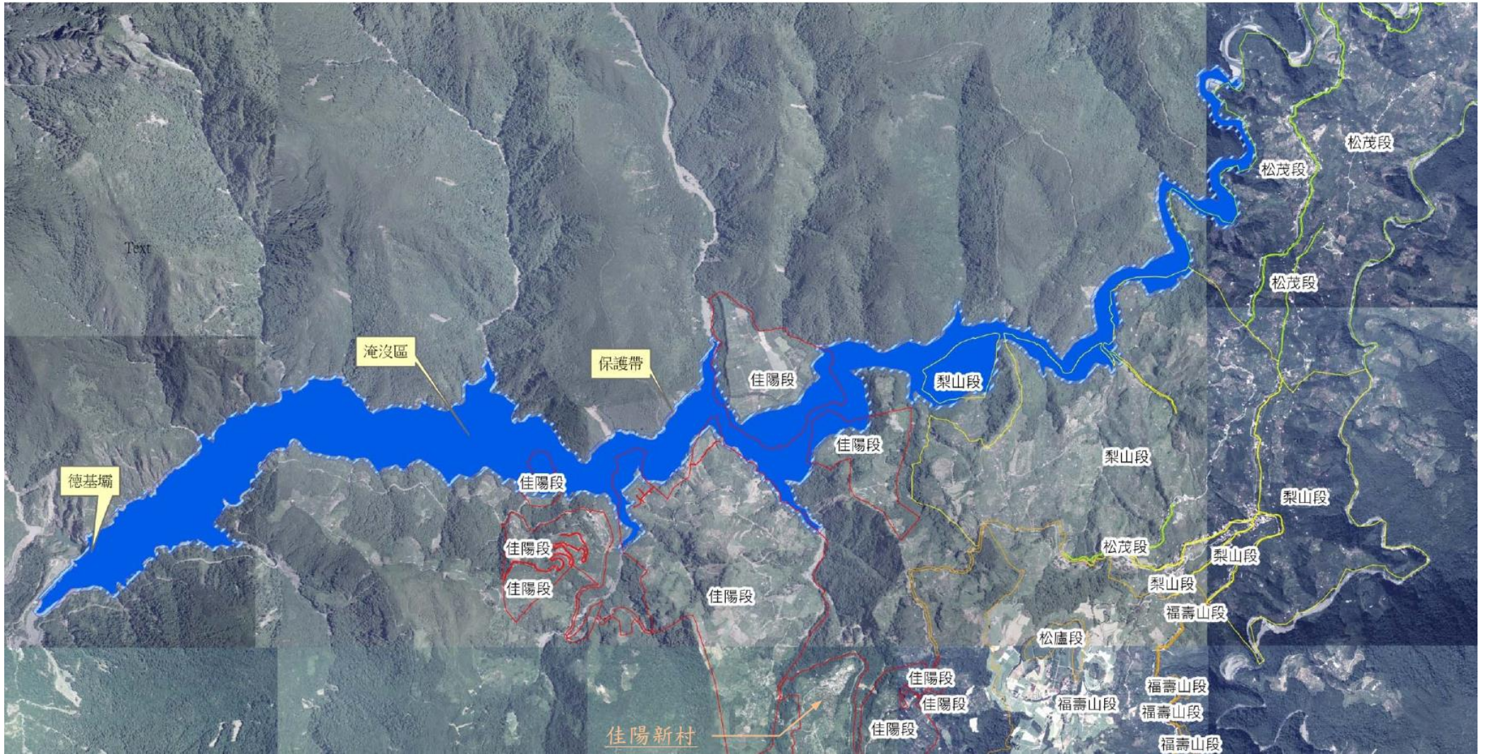
圖例：■ 淹沒區 ▨ 保護帶(縮圖所致) □ 佳陽段 □ 梨山段 □ 松茂段