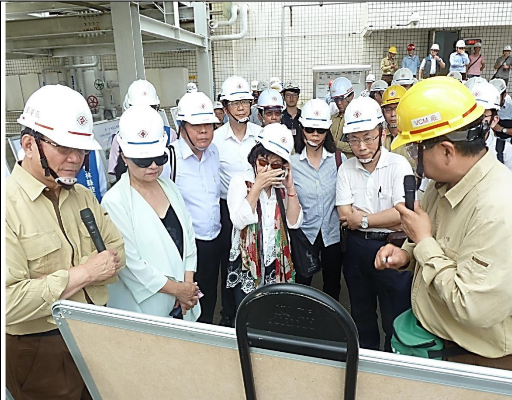
台塑集團簡報現場說明改善情形