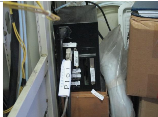
環保局平行比對電腦主機