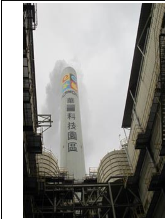
華○汽電廠排放管道