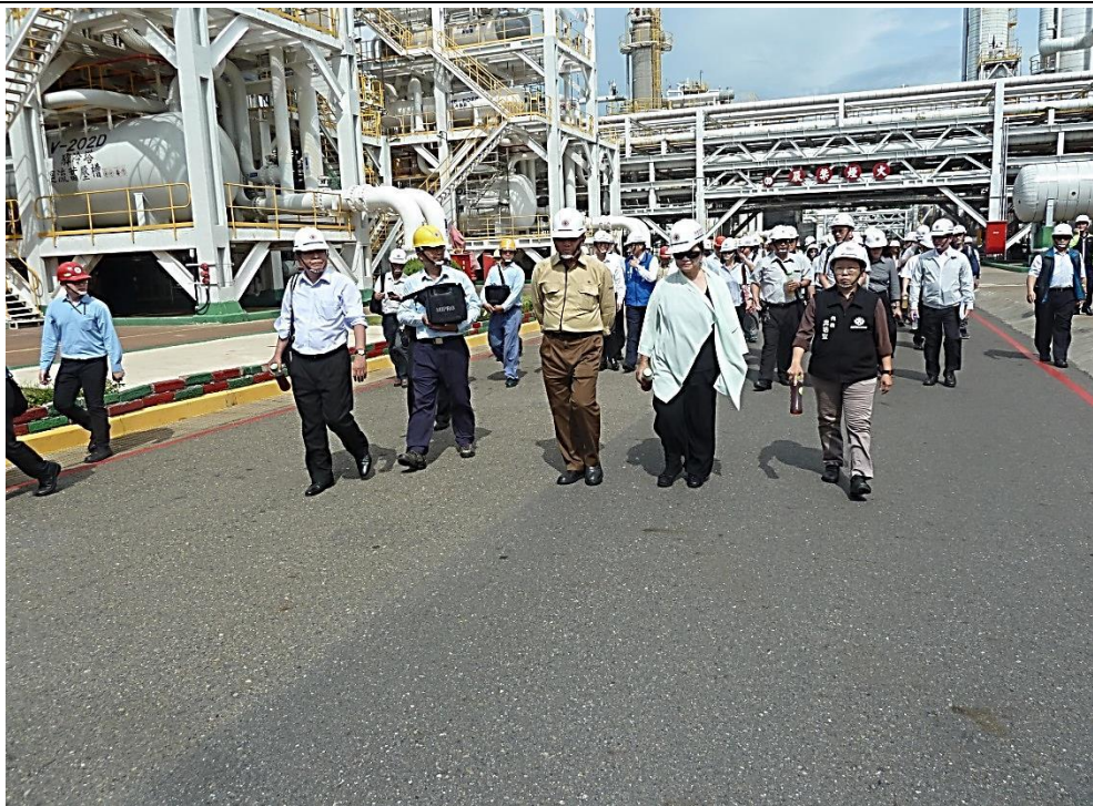
本院實地踏勘六輕工業區