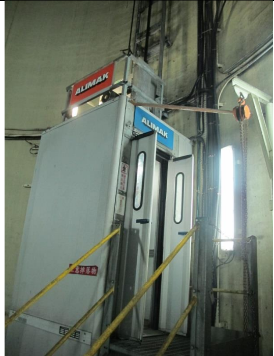
排放管道內部電梯