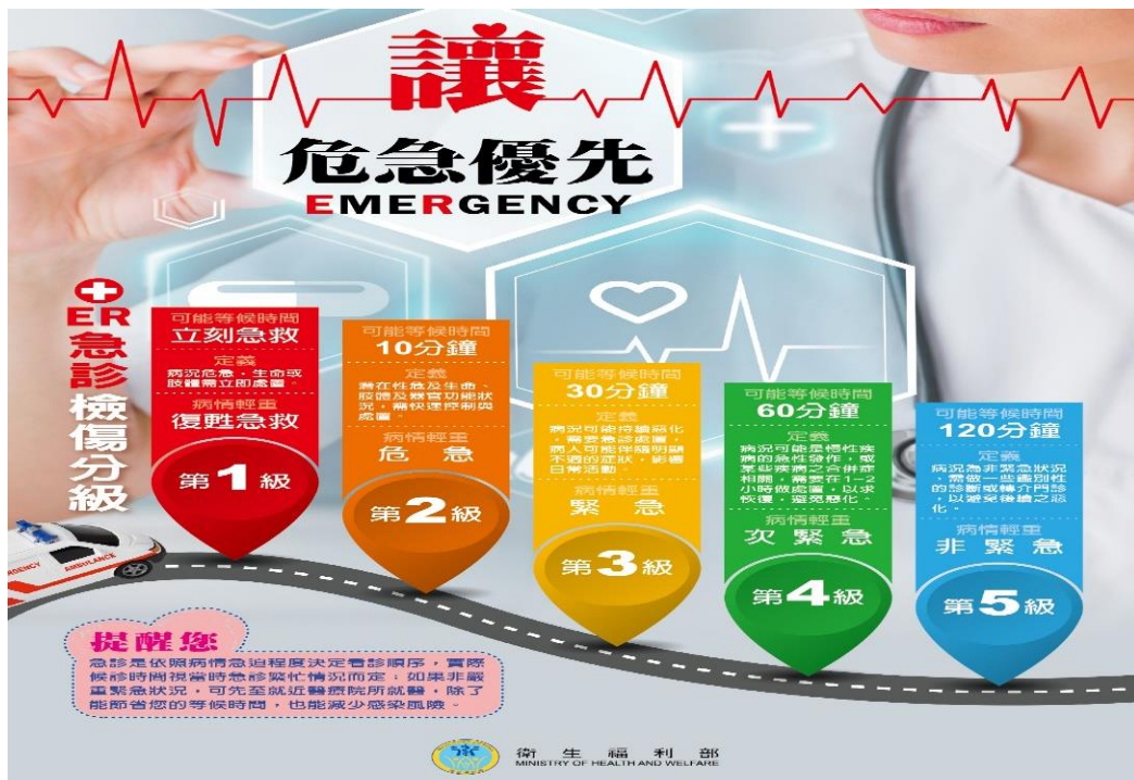
圖2 急診檢傷分級說明