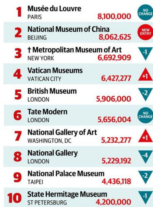
圖3 藝術新聞報《觀眾人次2017》The Art Newspaper: Figure 2017