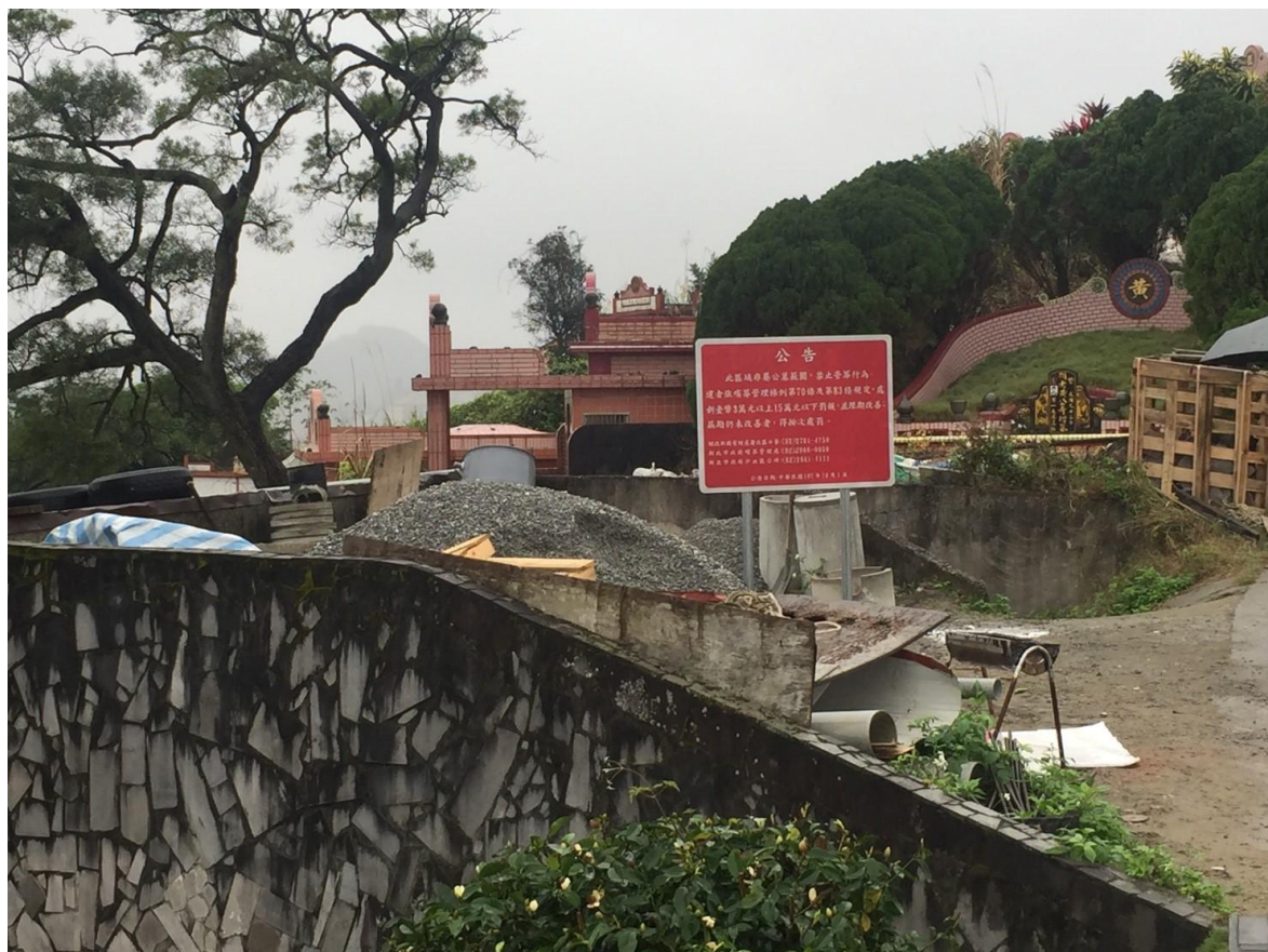
附圖二、「第八公墓」毗鄰遭墳墓占用之國有土地現況圖(一)