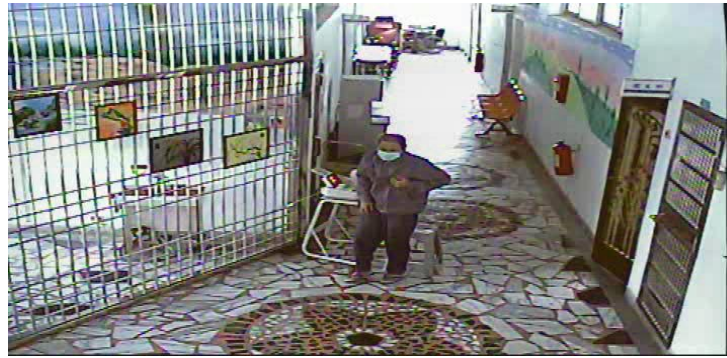
附圖 1 徐員 107 年 2 月 1 日外醫急診前之畫面截圖